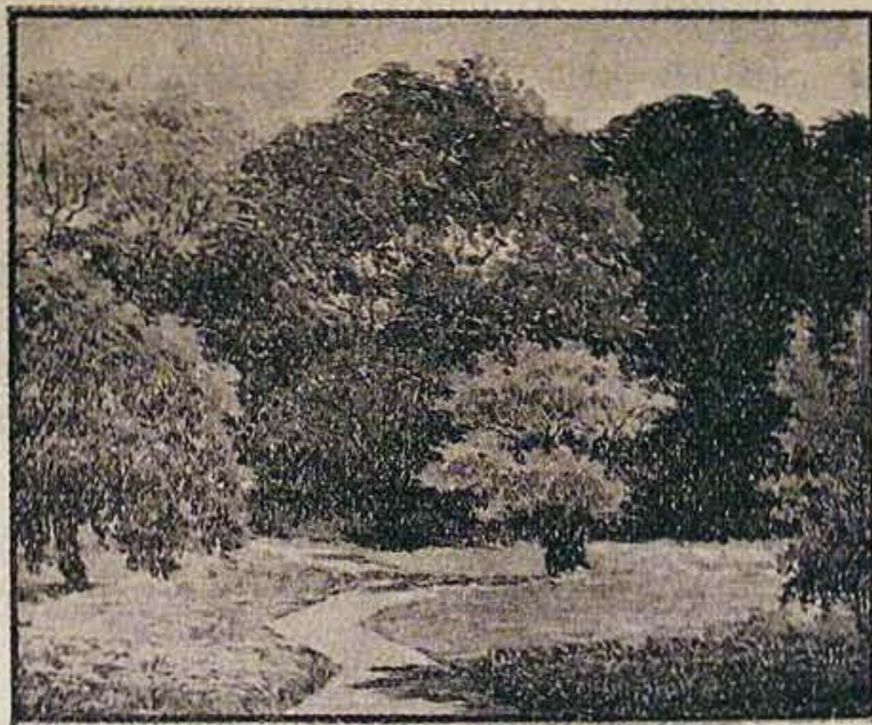
A MÚZEUM- KERT