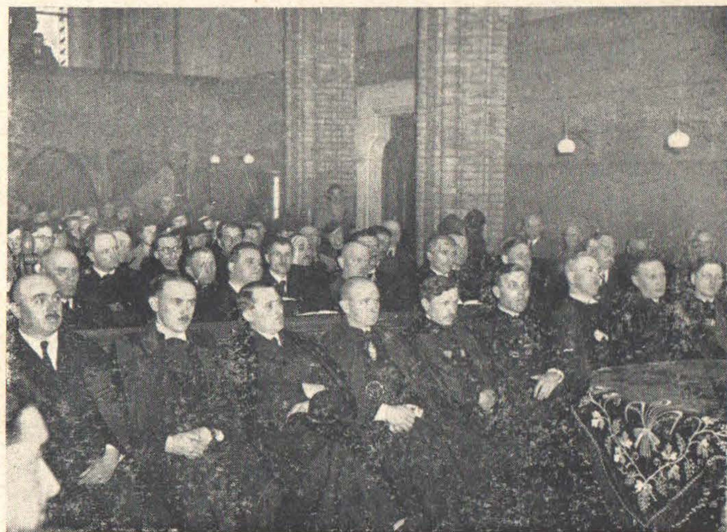
Palástos lelkészek és közönség a megnyitó ünnepi ülésen.