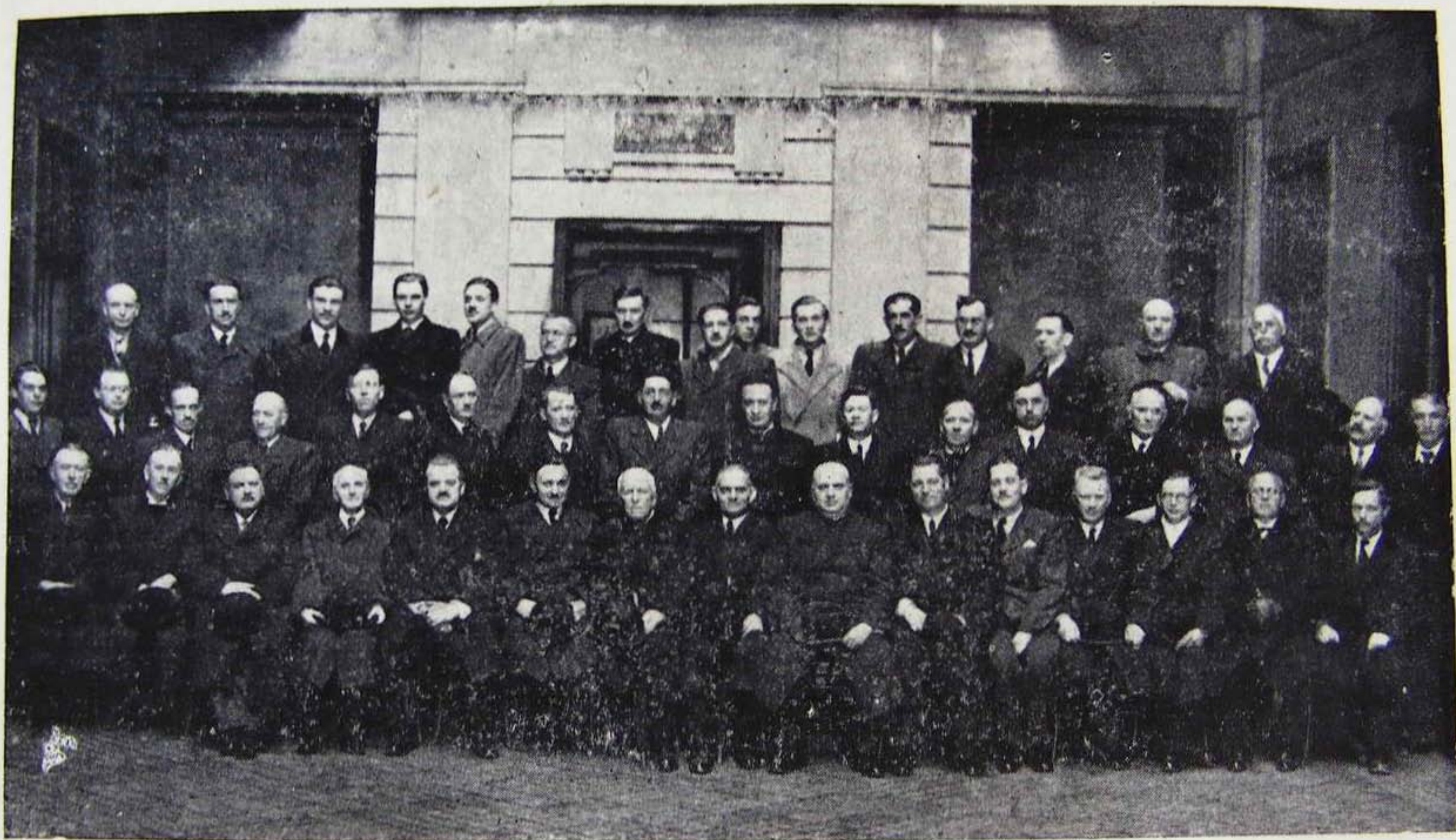
Lelkészek csoportja a Misszió Ház temploma előtt.