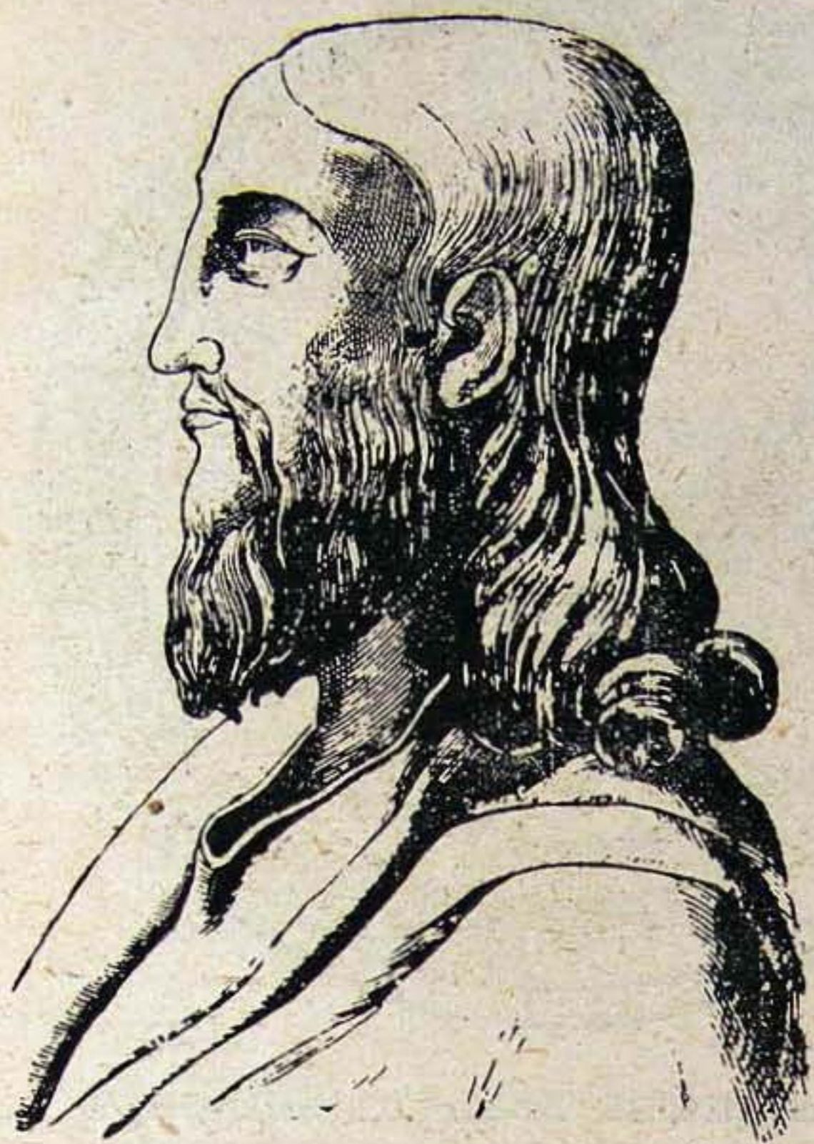
Krisztus-kép a VI. századból.

(Hiányzik a gloria s általában egészen emberi az ábrázolás.)