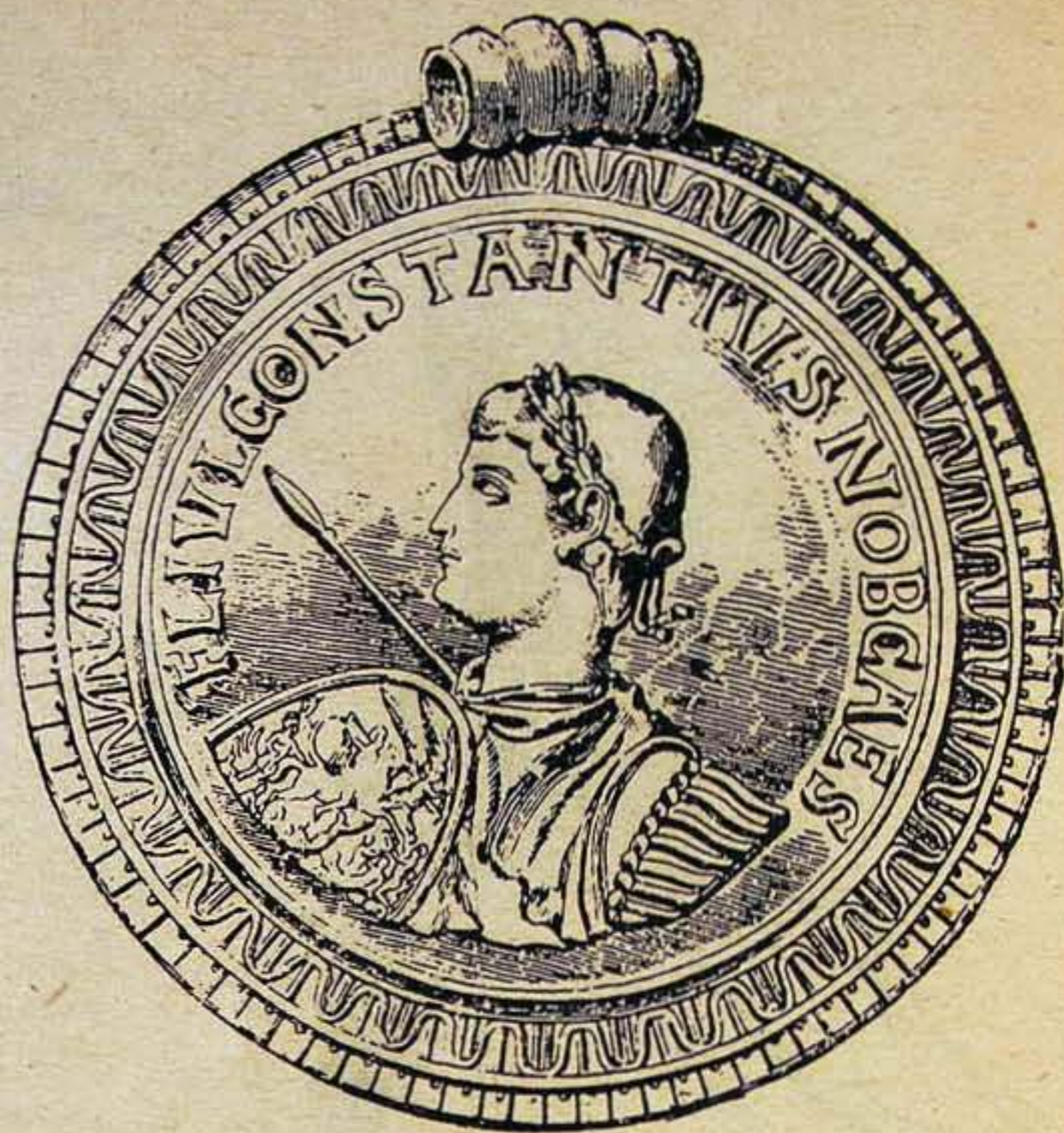
II. Constantius aranymedaillonja a szilágysomlyói kincsleletből.