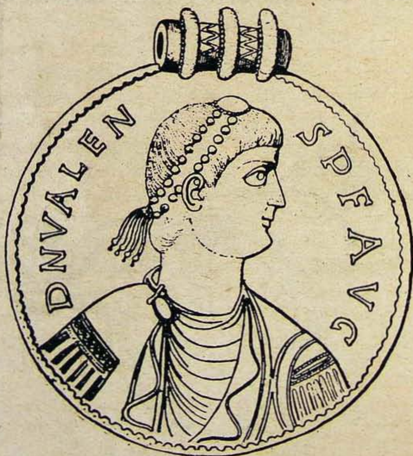
Valens császár aranymedaillonja a szilágysomlyói kincsleletből.