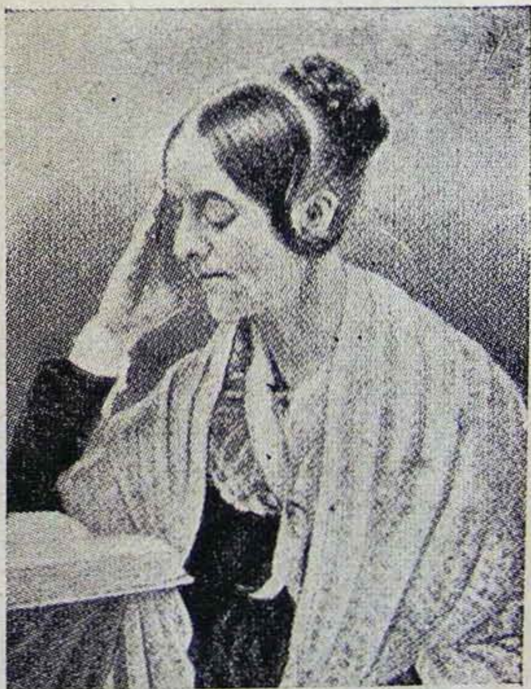
Fuller Margaret (Margit) író s a nők előjogainak harcosa.