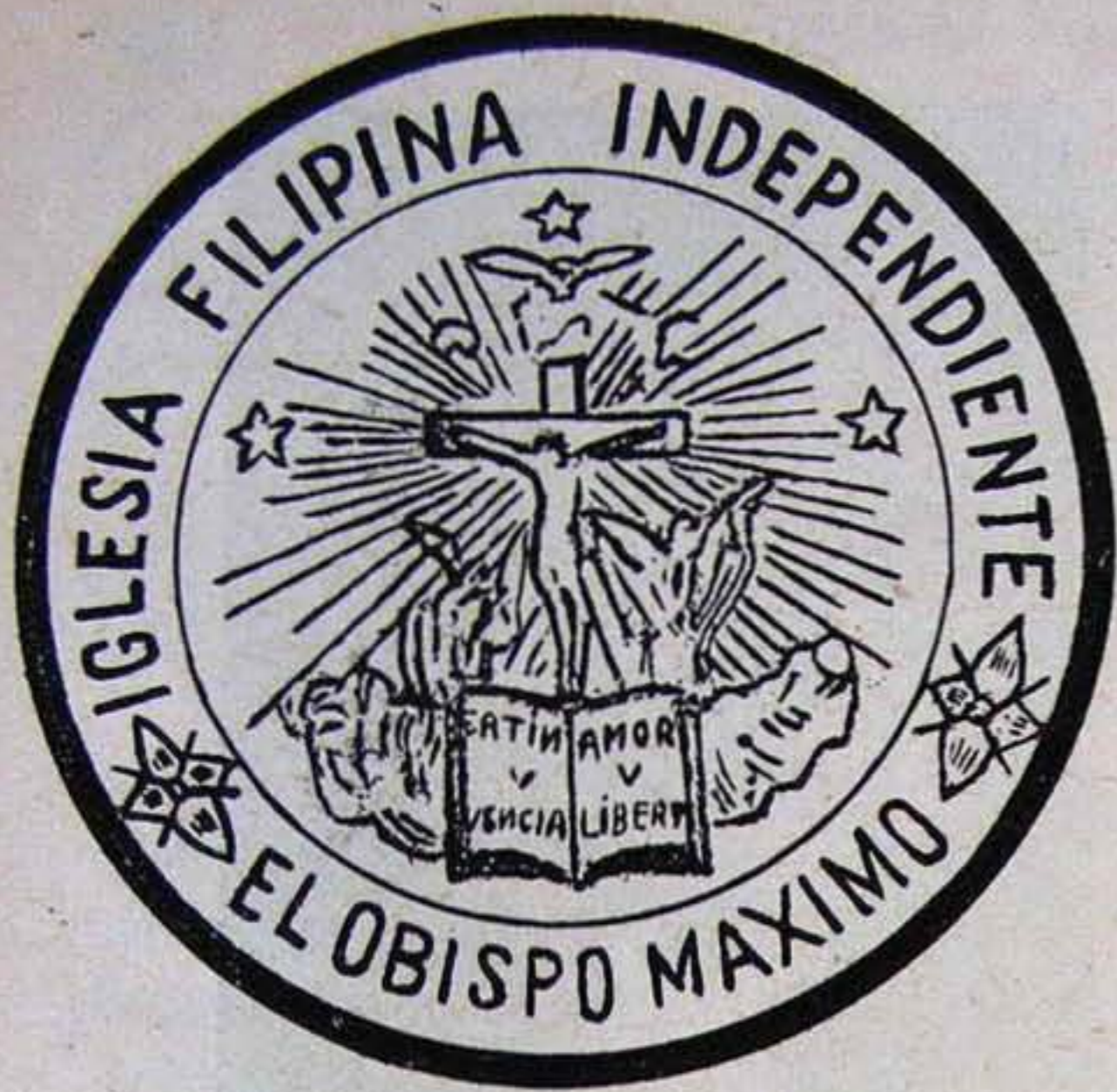
A Filipino Független Egyház érseki pecsétje.