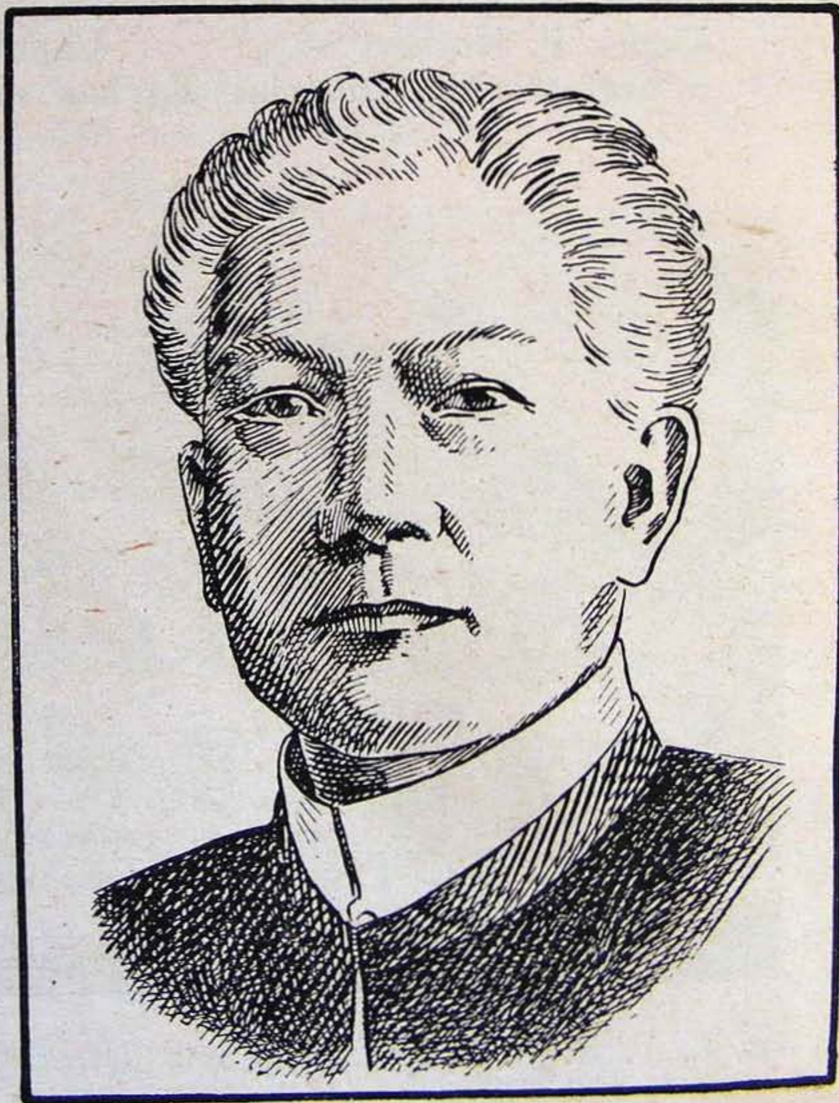
Gregorio Aglipay Y Labayan, a Filipino Független Egyház ér- seke, a Fülöp szigetek köztársaságának tá- bori főpapja, szabad- sághős és reformátor.