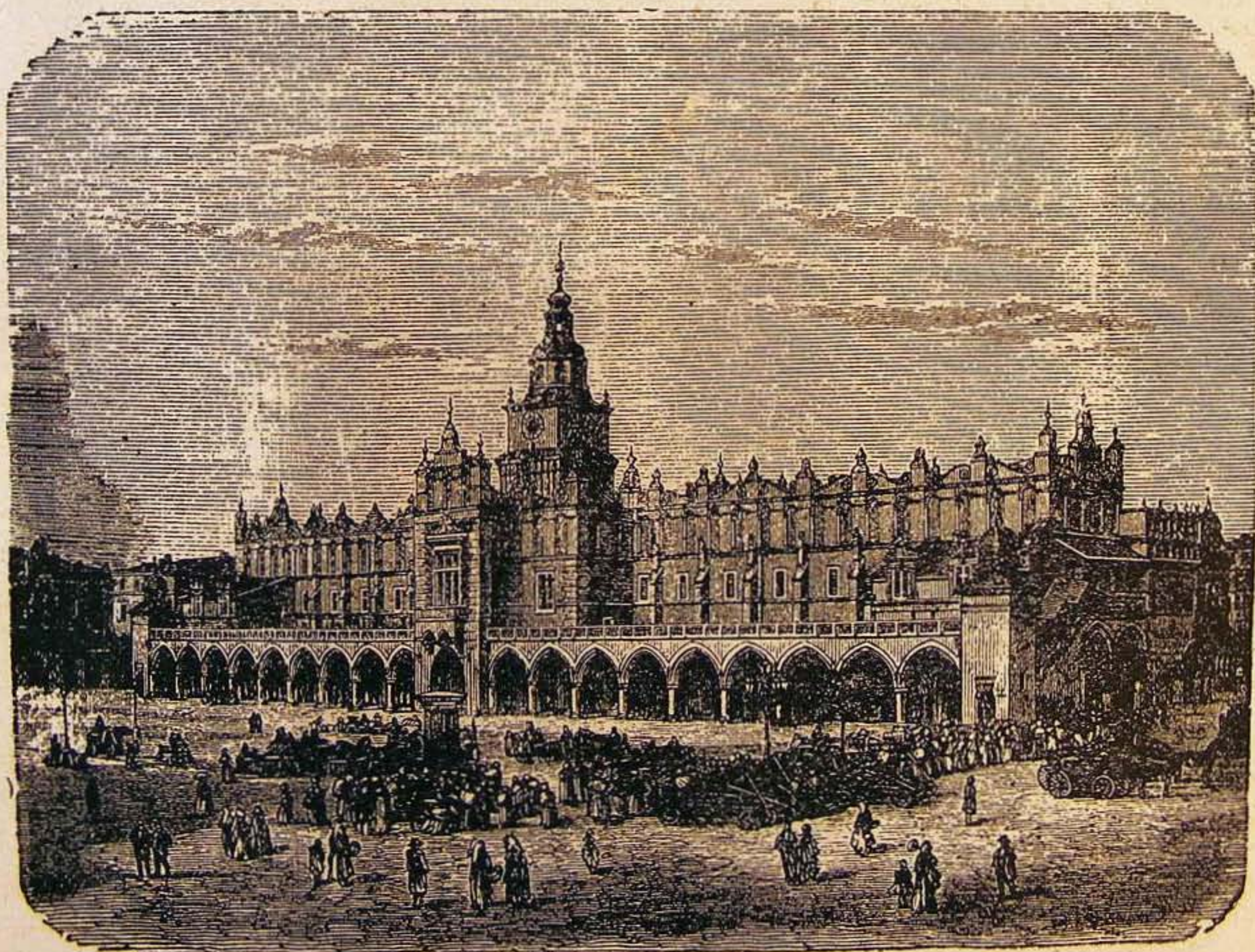
Krakkó főtere a XVII. században.