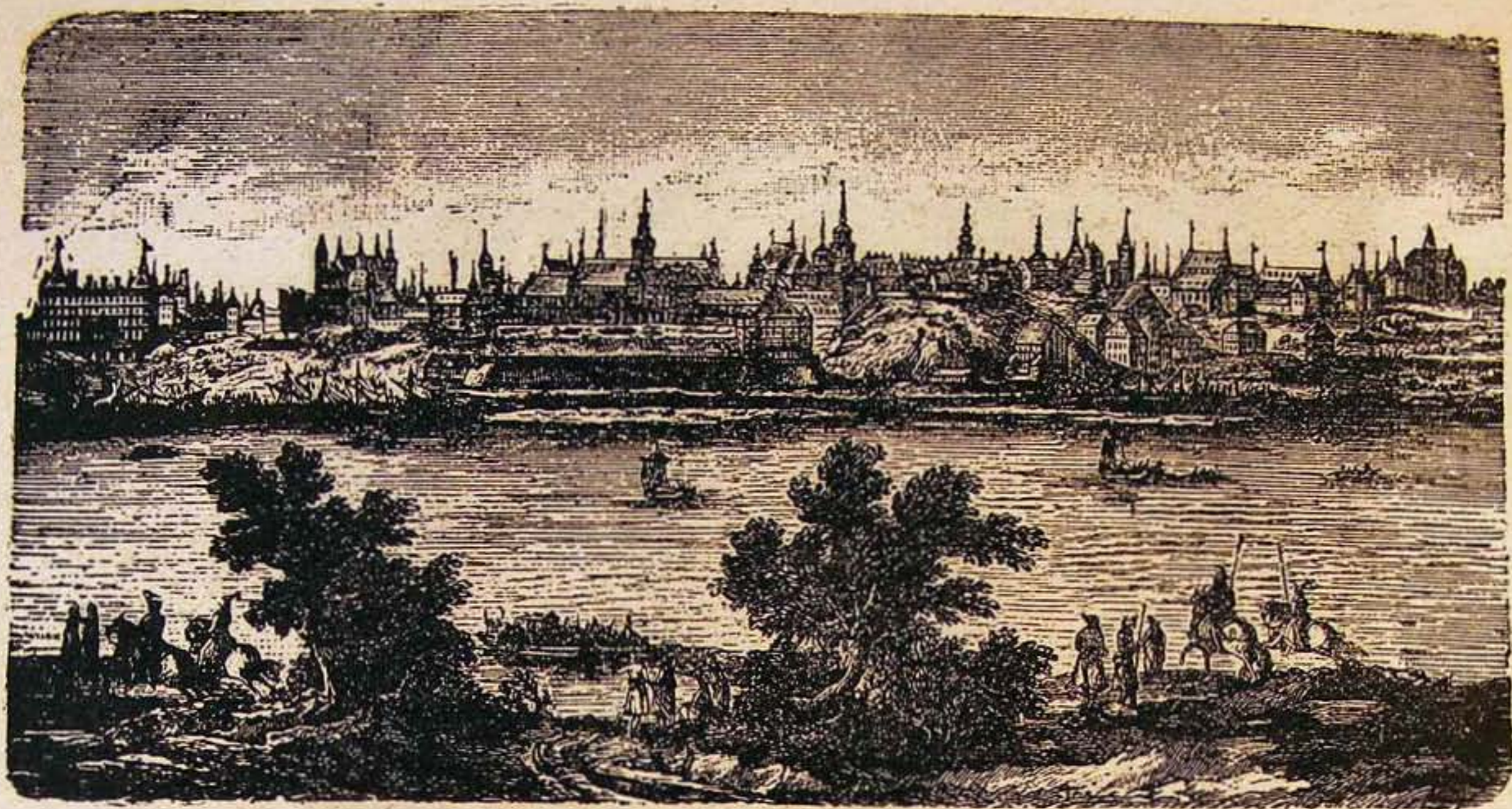
Varsó a XVII. században.