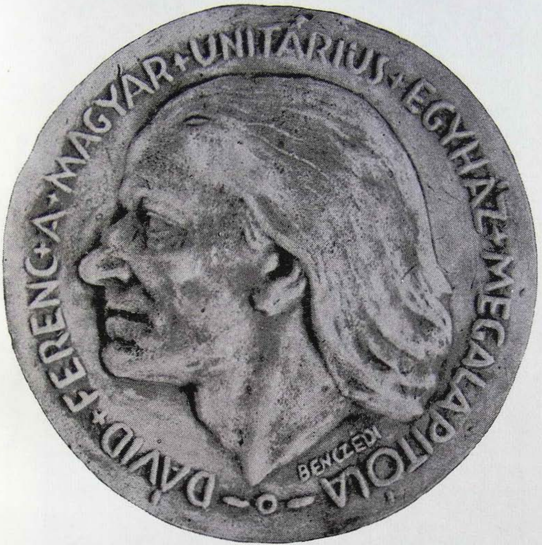
DÁVID FERENC 1520—1579