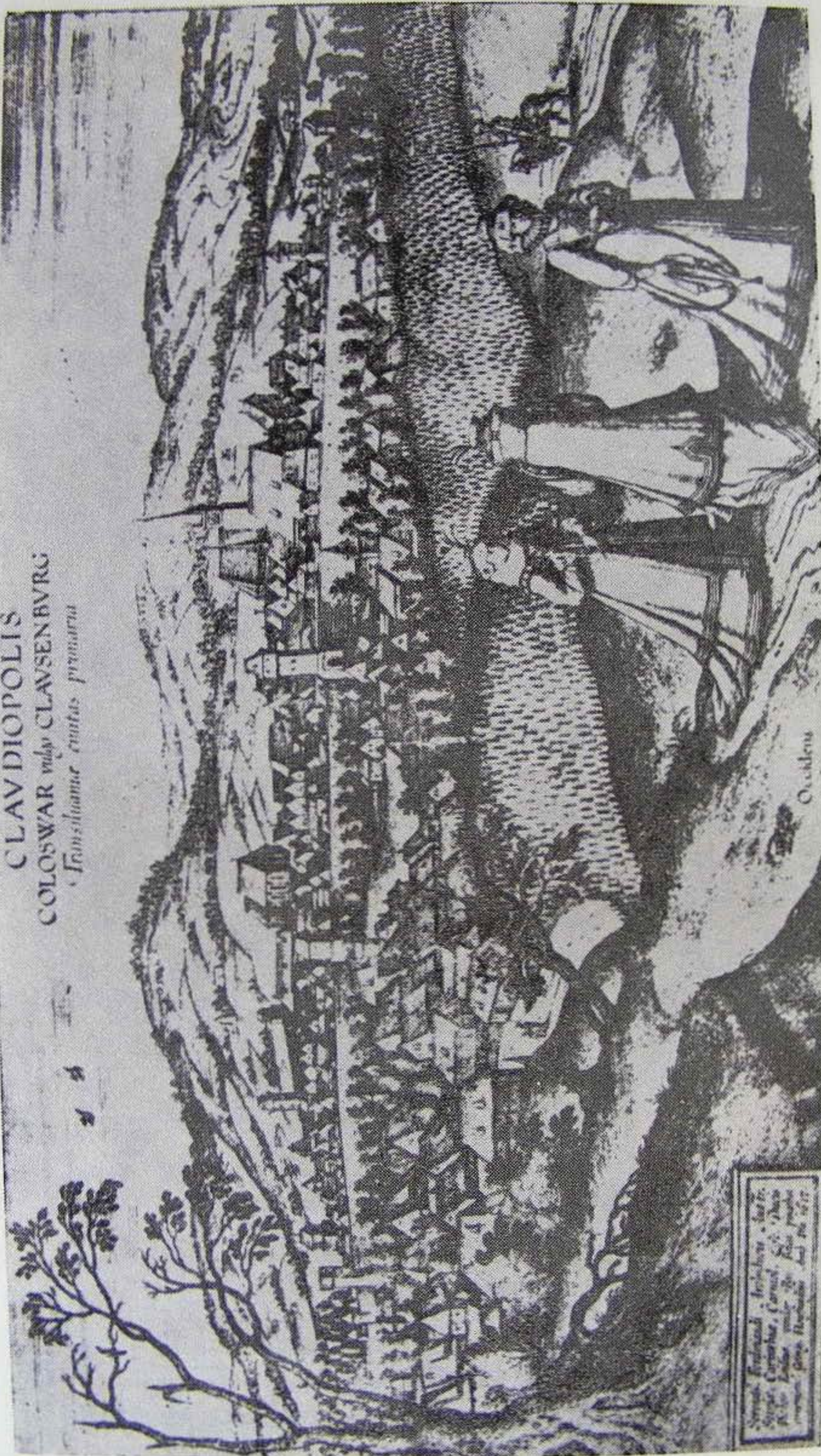
KOLOZSVÁR A XVI. SZÁZADBAN

CLAVDIOPOLIS COLOSWAR vulgo CLAVSENBURG Transilvanie civitas primaria