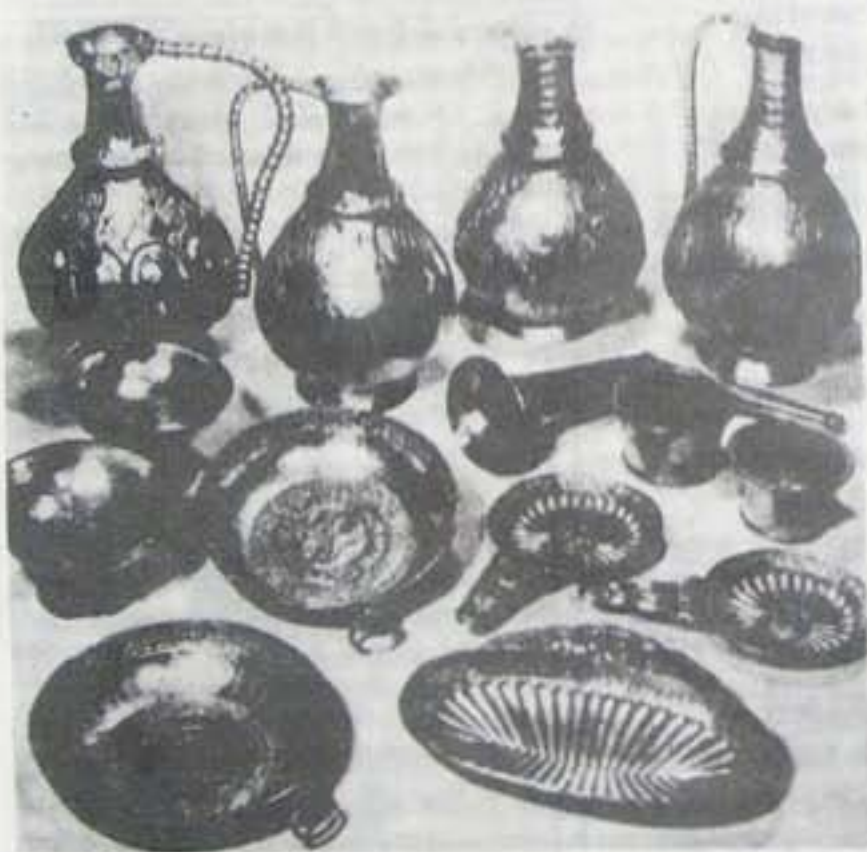
A nagyszentmiklósi aranykincs (valamennyi darab rovásírásos)