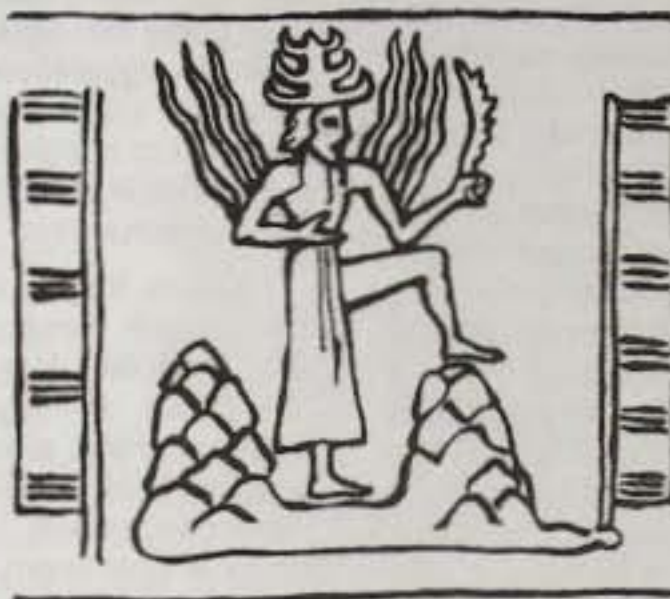
Samas napisten a föld és az ég kapujában. Babiloni akkád pecsétnyomat i. e. 2360-2180 körül

Milyen természetű lehet a világlétezők egységes alapja, a Világegyetem? Lehet-e, hogy a világlétezők bármelyike, a tudat, a mélytudat, az anyag, az élet, az emberiség, a nemzet ne tartozzon a Világegyetemhez? Azt hiszem, a világlétezők létének ténye a legtöbb ember számára világos. Másképp áll a helyzet a transzcendens, világon kívüli „isten” fogalmával. A transzcendens isten attól transzcendens, hogy nem a Világegyetemben, hanem rajta kívül tartózkodik. De gondoljuk meg alaposabban, nem ellentmondásos-e egy ilyen transzcendens, világfeletti világlétező fogalma. Ha ugyanis valami kölcsönhat a Világegyetemmel, akkor a Világegyetemhez kell tartoznia, hiszen minden, ami velünk kölcsönhat, a mi világunkhoz kapcsolódik. A Világegyetem viszont – fogalmának lényegéből adódóan – minden