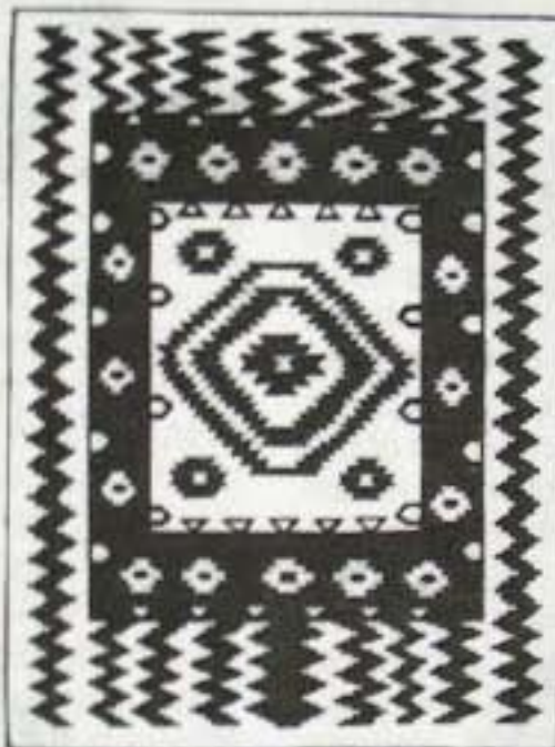
A Nap, a csillagok és a Tejút. Székely „festékes” szőnyeg

a Világegyetem egy olyan csodálatos élőlényként áll elénk, amelynek hét élete van: egyik az ékességként, káprázatos ékszerként ragyogó Világegyetem, másik a lelkek égi országútja, a Tejút, harmadik a Napisten, a földi élet forrása, aztán ott az Élővilág, az Emberiség, a Magyarság és a Személyes Élet. A Világegyetemnek hét élete van, és így minden lénynek hét élete van. A Világegyetem egy emeletes csillaghajó, ami még a mesevilágban épült, amikor még az Ember a Természet testvére volt, amikor jótett helyébe jót várhattunk, mert a Természet hallgatott szavunkra, hiszen még egy nyelven beszéltünk, egy elmével gondolkodtunk. A bennünk élő csodálatos, mágikus erő olyan világerő, amely a Kozmoszt mint világló csodaerőt, mesebeli szépségűnek mutatja ma is. Szemünk előtt ragyog, tündököl az égen: de igazi, legbensőbb fénye csak az élet-szerelem mámorító, testvériesítő, emberivé formáló látás előtt ragyog fel. Hét életünk van, és minden tettünknek hét jelentése, mert az emeletes mesehajó minden emeletén folyamatokat indít el, és ezekben értelmeződik.