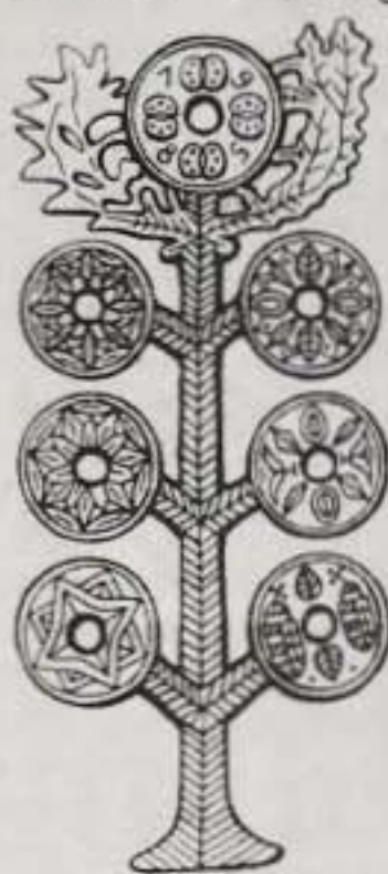
Kalotaszegi orsókarikó-esillagos világfa. Ólomöntvény

Mindez a tudás, az emberiség őstudása, eredetéről első kézből szerzett tudás legnagyobb részét elvesztett, a történelem erői barbár módon elsüllyesztették, felégették, kiirtották, és amire szükségük volt, azt lefedték, elrejtették, és ami megmaradt, barbárnak állították be. Ha elképzelünk egy családot, amelyben az édesapa és az édesanya meg tudja válaszolni gyermekeinek, hogy honnan származnak, kik is szüleik, nagyszüleik, családjuk, nemzetük, akkor felmérhetjük, hogy mi magunk mint nemzet, mint emberiség, nem ismerjük saját szüleinket, sorsunkat, történelmünket. Olyanok vagyunk, mint az az ember, akit elraboltak és injekciókkal kitörölték emlékezetét, annyira, hogy múltjából semmire sem emlékszik, életét a műtőasztaltól számítja, ahol felnőtten felébredt. Meddig látunk vissza? Az ókori görögökig? Néha Mezopotámiáig, Egyiptomig? És honnan számítjuk a saját történelmünket – évmilliók óta, vagy kétezer év óta? Az indiánok többet tudnak eredetükről, eredeti kultúrájukról, mint