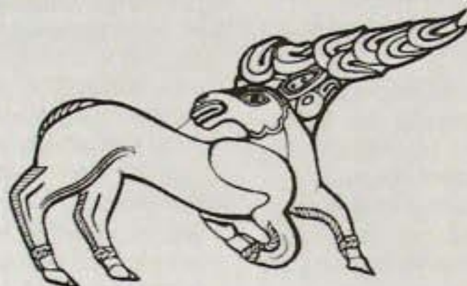
Szkíta aranyszarvas. Zöldhalompusztá