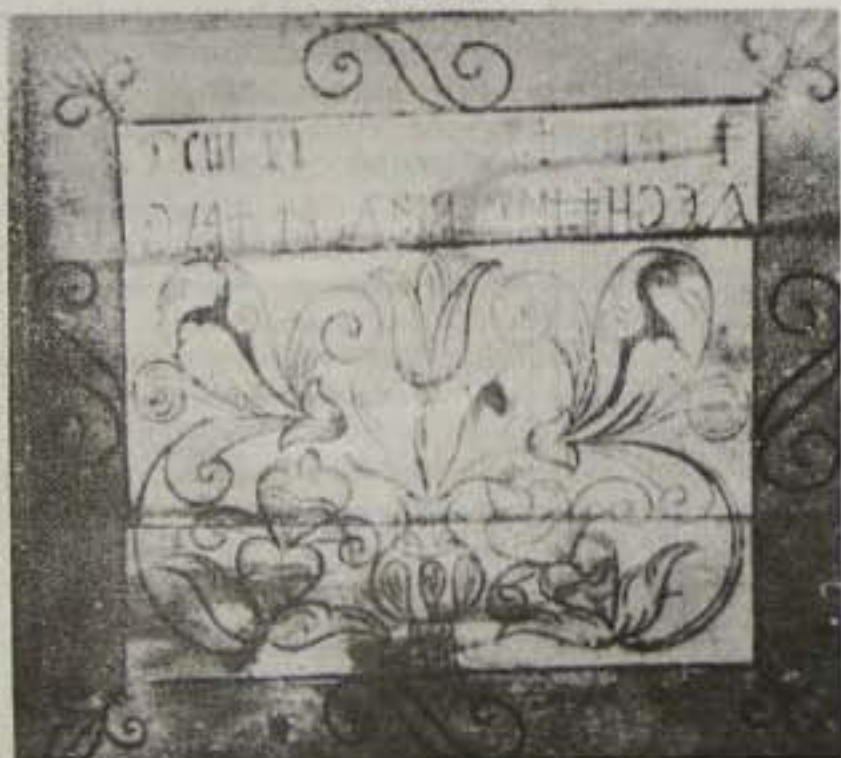
Az énlakai unitárius templom rovásfelirata 1668-ból