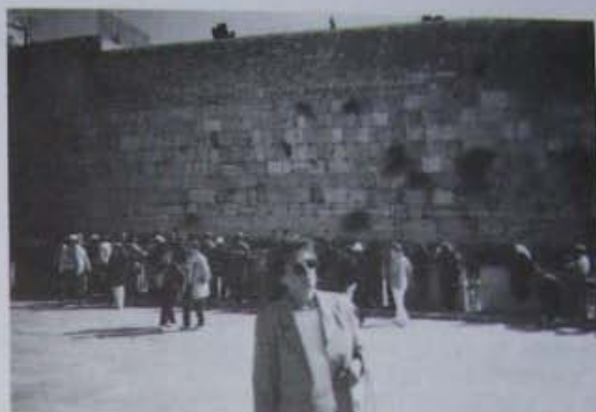
A szerző a Siratófalnál

A zsidó emlékhelyek közül legnevezetesebb a Nyugati fal. A Siratófal nevet onnan kapta, hogy a zsidók itt siratják a jeruzsálemi templom pusztulását. A ráccsal elkerített falat zsinagógának használják. Jobbra a nők, balra a férfiak imádkoznak. Itt avatják férfivá a 13. évet betöltött fiúgyermeket.