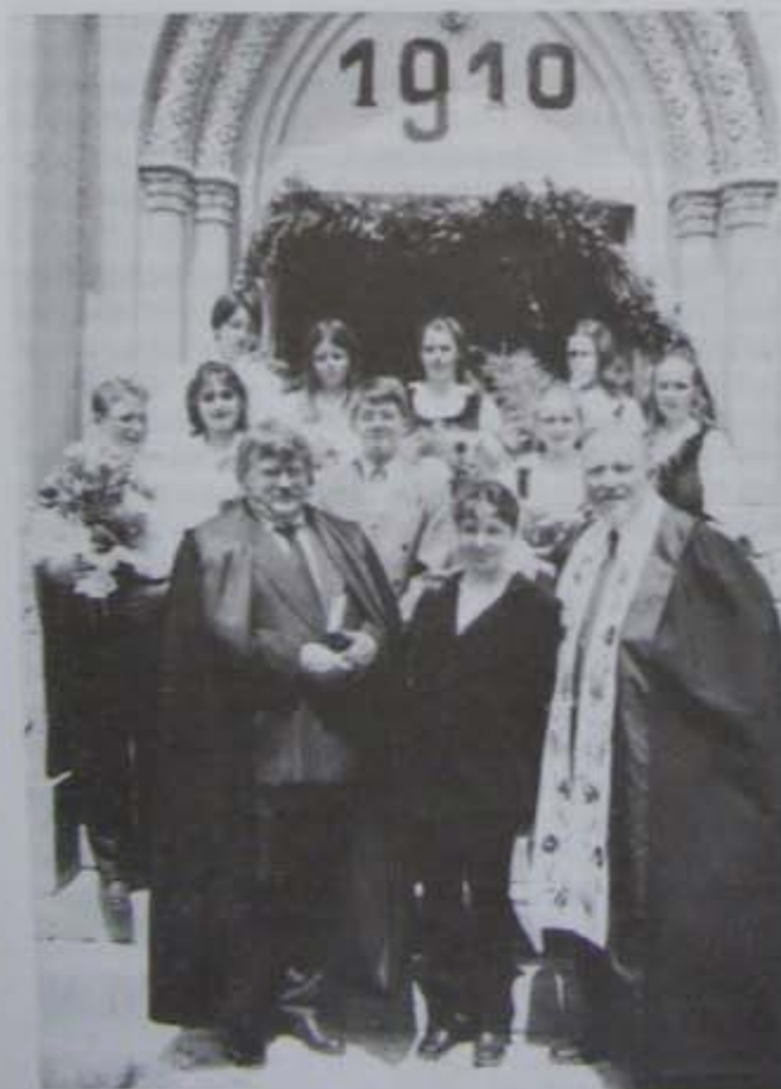
Konfirmálás Hódmezővásárhelyen 2000. július 2-án.