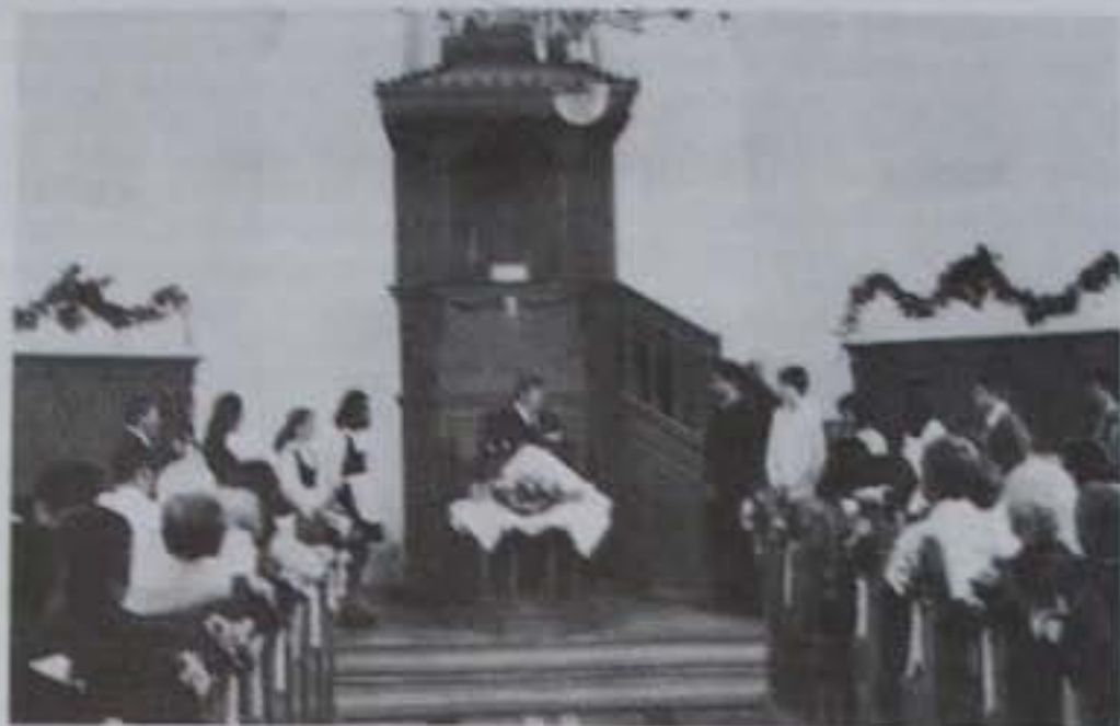
Konfirmálás Hódmezővásárhelyen 2000. július 2-án.