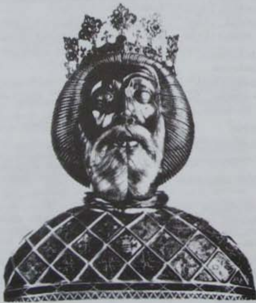
I. László király fejereklyetartója