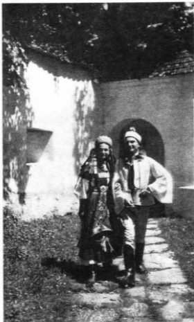
„A régi Torockó” Fotó: Fischer J. 1938

Mindezt Isten is akarja és várja tőlünk. Azért ígéri az „új eget és új földet”. Azért ajándékozott meg az étellel és helye-