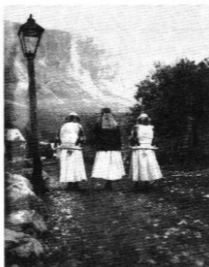
„A régi Torockó” 1929.

Jézus nem csupán azt élhette át, hogy az Istennel való kapcsolat alaphangja – Keresztelő Jánossal ellentétben – nem az, hogy a „feszete immár a fák gyökerére vetetett”. Azt is átélhette, hogy a megtérés egyáltalán nem feltétele a Jahveh irgalmának, hanem megjelenési módja. Jézus saját örömeibenől visszafelé rekonstruálható, hogy számára a „megtérés”, a „tesuba” inkább egyfajta magatartásmód vagy létállapot, mintsem kötelesség vagy feltétel. Egészen nyilvánvaló lett az is, hogy Jahveh derűje nem ígér könnyű, gondtalan életet. Az a tény, hogy éppen az Ebed Jahvét idézi a mennyei szózat, bizonyítja, hogy az Úr szolgálja „szenvedő” szolga. Javeh irgalma – ellentétben az akkori közfelfogással – nem az anyagi jólét, a politikai függetlenség, a külsőség békeje. Ebben az irgalomba belefelel, szót bele kell férjen, Jézus életében pedig döntő elemmé vált a fájdalom, a szenvedés. És ez mégsem tűnt „rettentésnek”. Eppen ellenkezőleg. Valami különleges bizonyosság hatotta át az élményt. Az Úr a szenvedéssel is közölni akar valamit, de főleg az a bizonyosság, hogy az Úr a szenvedésben még közelebb, egészen közel kerül az emberhez.