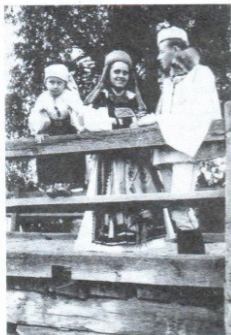
„A régi Torockó”