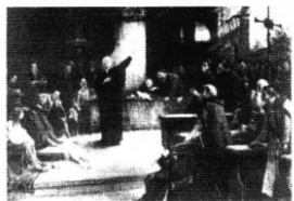
Körösfői Krisch Aladár festménye

Dávid Ferenc is, mikor a reformáció útjára lépett, felismerve annak lehetőségét, engedett a jézusi felhívásnak: Legyetek tökéletesek, miként a ti mennyei Atyátok is tökéletes! (Mt 5,48). Ki lett mondva „Egy az Isten”, és hogy nincs nagyobb esztelenség, sőt lehetetlenség, mint külső erővel kényszeríteni a lelkiismeretet s a lelket, mely fölött hatalommal csak teremője bír. (Dávid Ferenc)