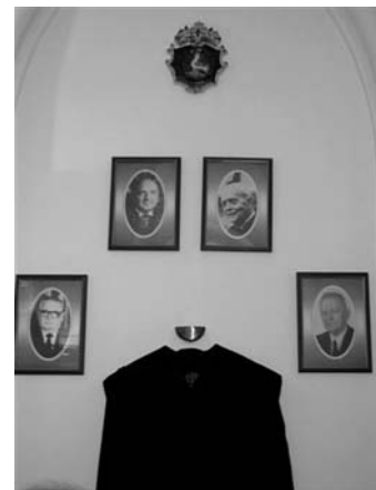
A püspöki fal