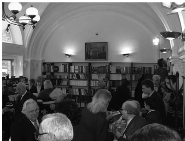
A megnyitott könyvesbolt

A könyvszerető, utcáról betérő vevőink mellett természetes elvárás az, hogy az Unitárius Egyház Könyvtára is nálunk szerezzé be a működéséhez, választékbővítéséhez tervezett könyveket.