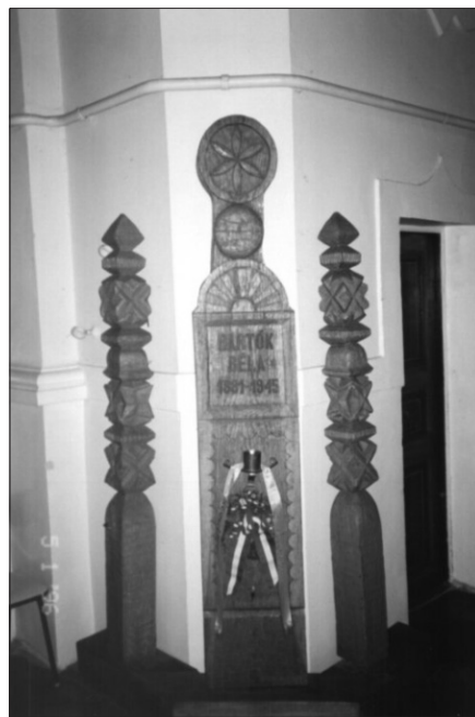
Bartók Béla-emlékoszlop a Hőgyes Endre utcai unitárius templomban. (Zágoni Sándor alkotása) Felirat: Bartók Béla 1881. március 25. – 1945. szeptember 26.

A Misszióház, melynek épülete és temploma a Hőgyes Endre utcában van, 2001-ben felvette a Bartók Béla Unitárius Egyházközség nevet, hogy ezáltal is emlékezzen rá és örökre marandóvá tegye e nevet és örökséget.