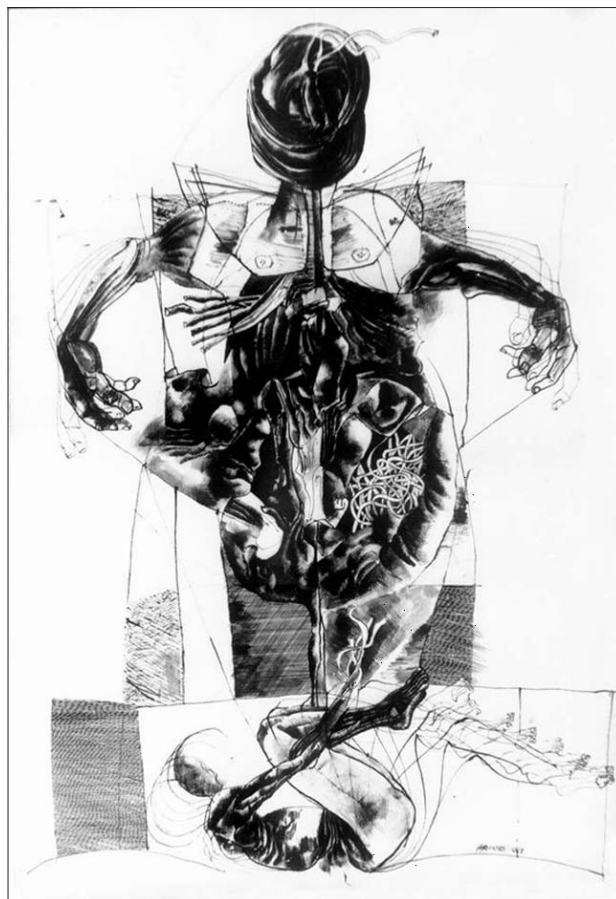
Variációk egy Bartók-témára III. (65x45 cm diófapác, kréta, papír)