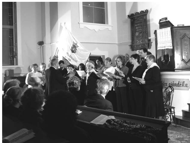
A Baráti Kör kórusa