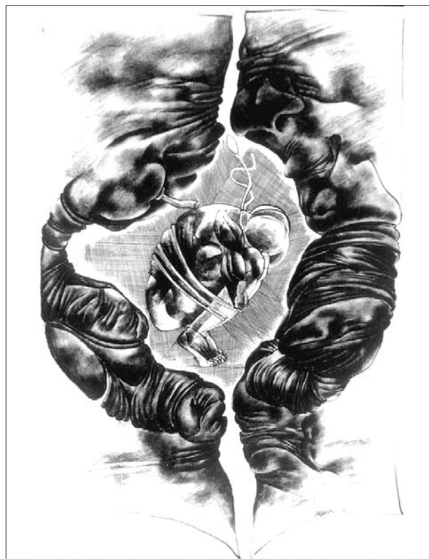
Variációk egy Bartók-témára III. (65x45 cm diófapác, kréta, papír)