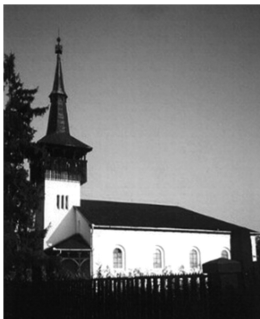
A 2006-ban felújított kocsordi unitárius templom