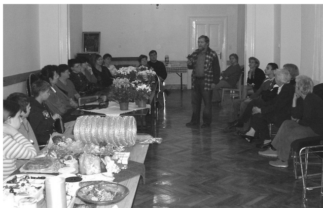
A nőszövetség rendezvénye