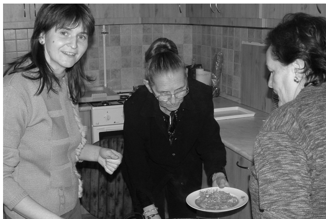
Munka a megújult konyhában

Az utóbbi néhány évben kívül-belül megújult a pestszentlőrinci Havanna-lakótelepi, az idén 70 éves