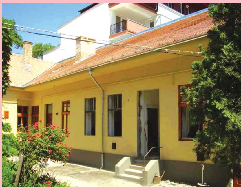
Képek a felújított debreceni templomról és lakásról