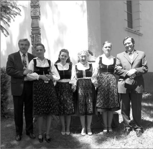
Felsőrákosi kopjafaavatók a templomkertben