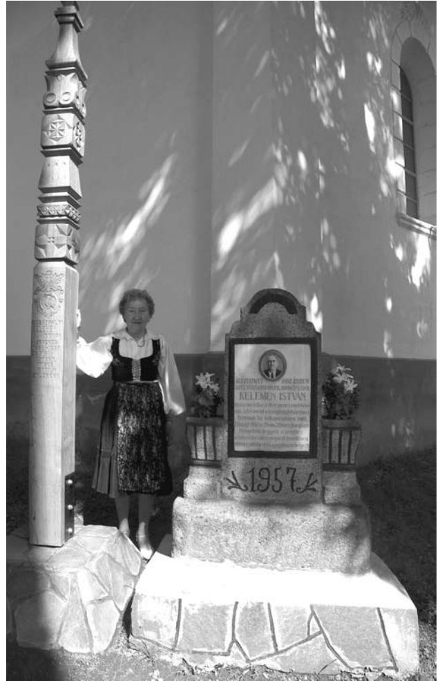
A kopjafa és az emlékmű – Édesanyámmal

Ha templomba menet, és onnan jövet ránéznék a kopjafára, jusson eszükbe a lelkési palástot viselő ember, és emlékezzenek rá akkor is,