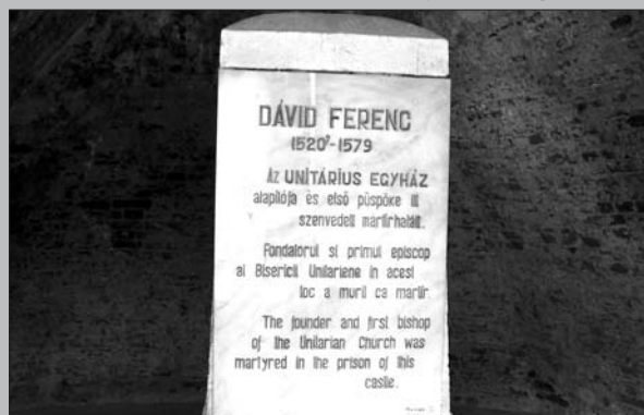
A dévai várban elhelyezett felirat és Dávid Ferenc-emléktábla képe