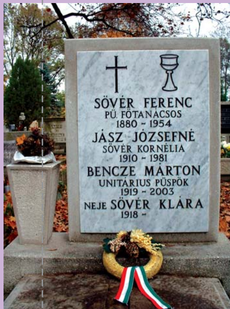
Bencze Márton Óbudai temető