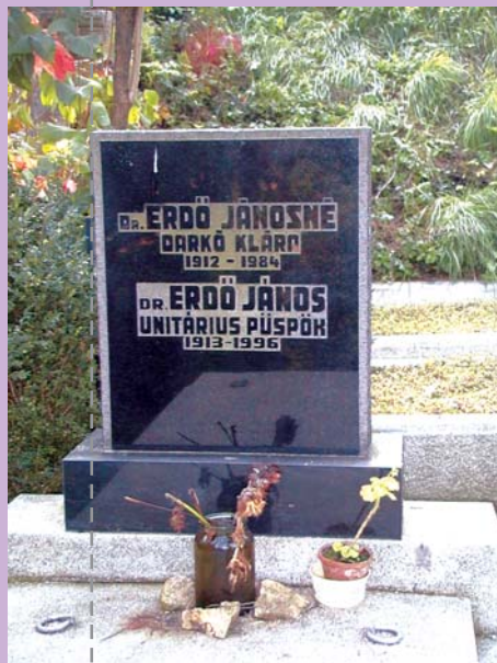
Erdő János Házsongárdi temető