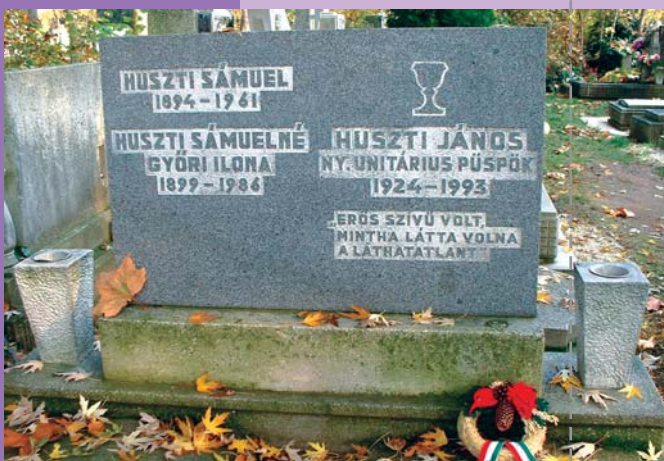
Huszti János Pestszentlőrinci temető