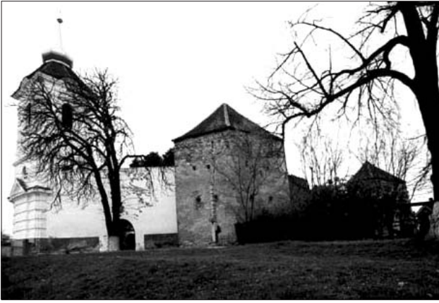
Az árkosi templom

látóink vezetésével ellátogattunk Zágónba, ahol megnéztük a Mikes-kúriát. Csomakőrösön láthattuk Kőrösi Csoma Sándor szobrát. Kovásznán a kénes fortyogót csodáltuk meg. Kézdivásárhely azzal a rendkívüliséggel szolgált, hogy minden utcája a főtérről nyílik. Ágyúöntő Gábor Áron főtéri szobra őrzi a rendet a városkában. A sok-sok aznapi élményt szinte betetőzte a Szent Anna-tó meglátogatása. Az idő nem volt nagyon kegyes, de gyönyörködésre jó volt. Én megettem a minden évi sétát a tó