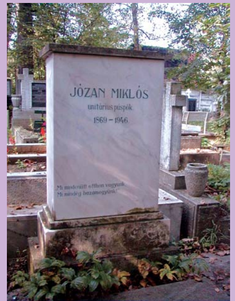
Józán Miklós Házsongárdi temető