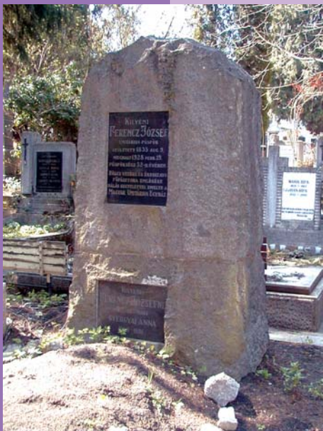
Ferenc József Házsongárdi temető