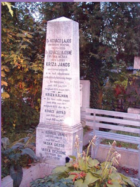
Kovács Lajos Házsongárdi temető