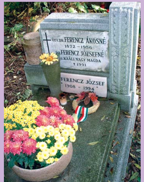
Ferenc József Farkasréti temető