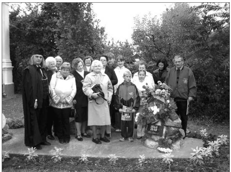
Gyülekezeti tagok az „Aradi 13 Vértanú” emlékművénél

Érdekfeszítő előadást hallhattunk életéről, őseiről, pályájáról, a forradalomban való részvételéről, majd tragikus végéről. Bár a király által kinevezett miniszterelnök volt, a Habsburg-ház nem tudta megbocsátani az 1848 tavaszi-nyári tetteit, pedig a bécsi udvar hangoztatása szerint Magyarország csak az 1848. ok-