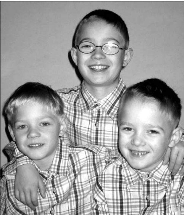
Az életben maradt testvér három gyermeke

A 8 egyetemista, 2 főiskolás, 8 technikai iskolás és 6 középiskolás, felekezeti hovatartozás nélkül, közel negyedmillió forintot kapott. Ebből a nagylelkű családfő közel 150 ezer forintot adott, mert a kamatok és az 1%-os átutalások nem képeznek nagy összeget. Fájdalommal mondjuk el, hogy a múltban több éven át díjazottak elfelejtették az alapítványunkat támogatni az 1%-os rendelkezésükkel. Jó lenne, ha eszükbe jutna, milyen jól jött nekik akkor a segítség!