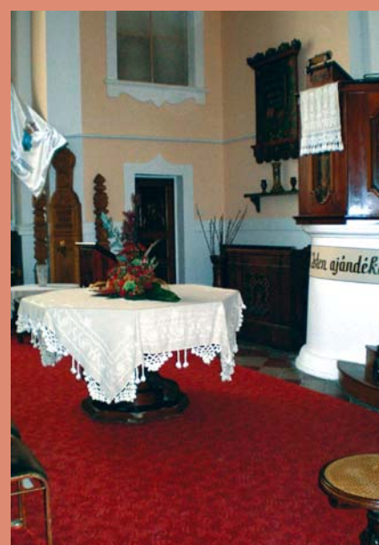
A felújított Bartók Béla Egyházközség temploma