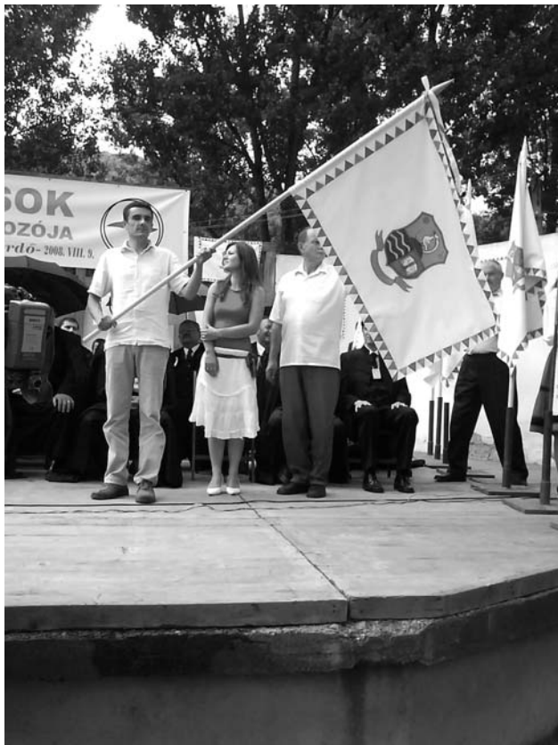
A szejkefűrdői zászló átadása a Beregi Unitárius Szórvány részére, a zászlót átadta Rázmány Csaba püspök úr

Az őszi hálaadásra megjelenő ÉRTESÍTŐ (a beregi unitárius szórvány negyedévi lapja) a jelenlegi állapotot elemezve kritikus hangon szól az ifjúsági munka hiányosságairól: