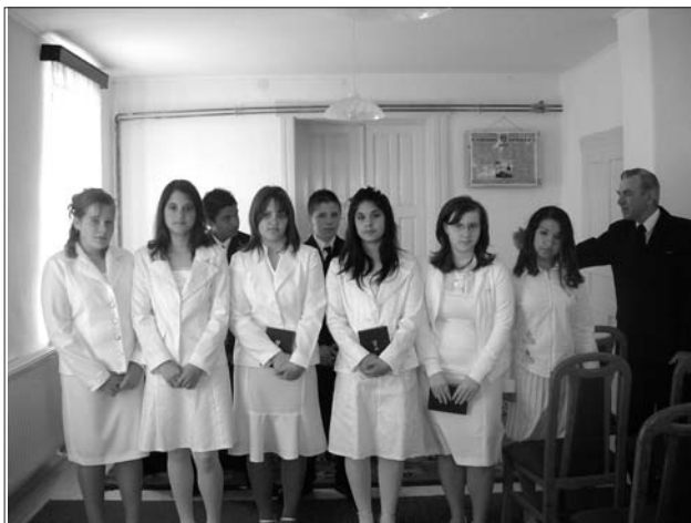
Konfirmáció – Kocsord, 2008. április 27.

Az istentiszteleteket és szertartásokat az előírásoknak és a bejelentett igényeknek megfelelően megtartottuk. A lelkeszi szolgálatot érintő igények tárgyában egy felszólamlástól a