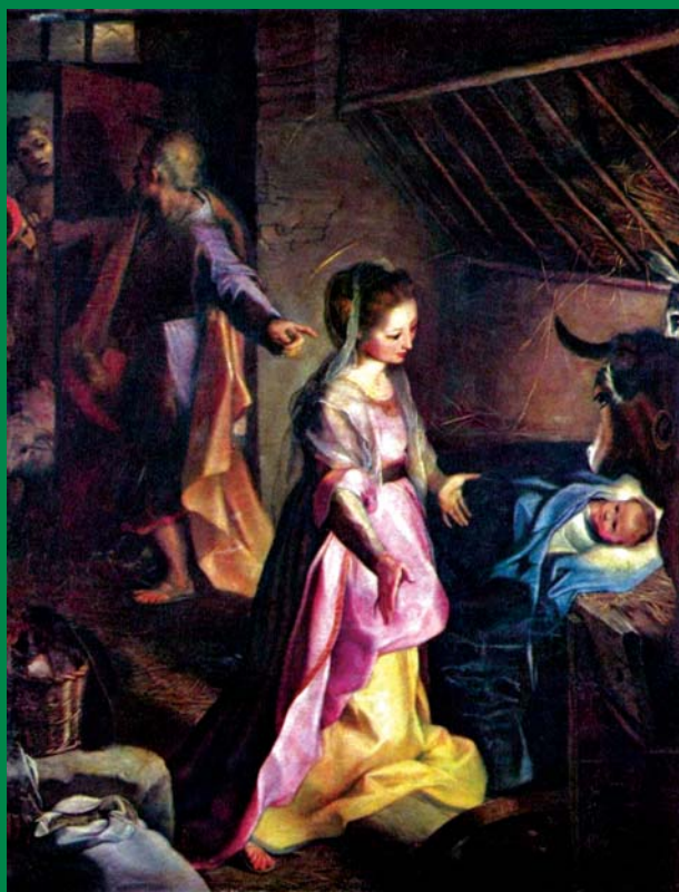
Federico Barocci: Szent éj (1593.)

Kéthavonta megjelenő folyóirat · 2008. november–december · 62. évfolyam 6. szám