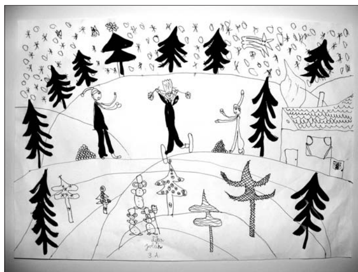
Léta Jolán rajza

nyugatnak tartva. A pásztorok azt mondják látták, amint megállt és világítani kezdett egy egyszerű istálló felett a kis városkában. Azt nem