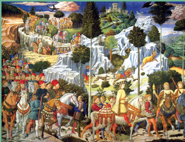
Benozzo Gozzoli: A háromkirályok vonulása (1459–1461.)