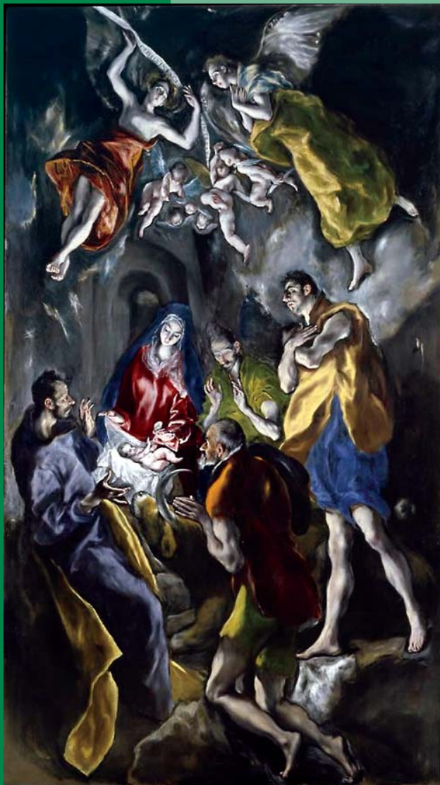
El Greco: Pásztorok imádása (1579.)