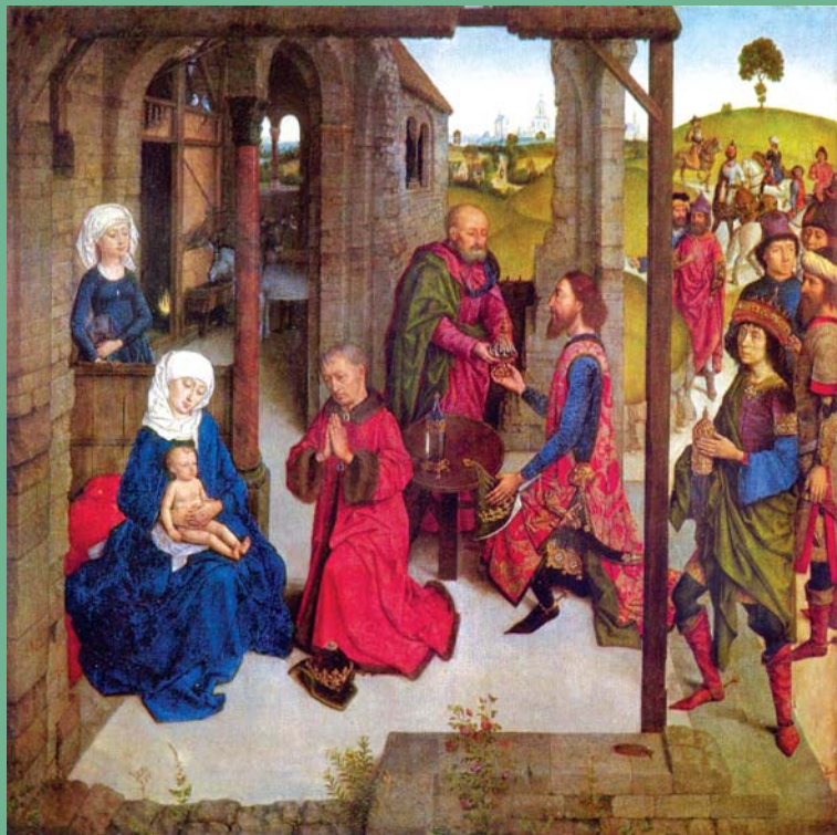
ifj. Dirk Bouts: Királyok imádása (1470 körül)