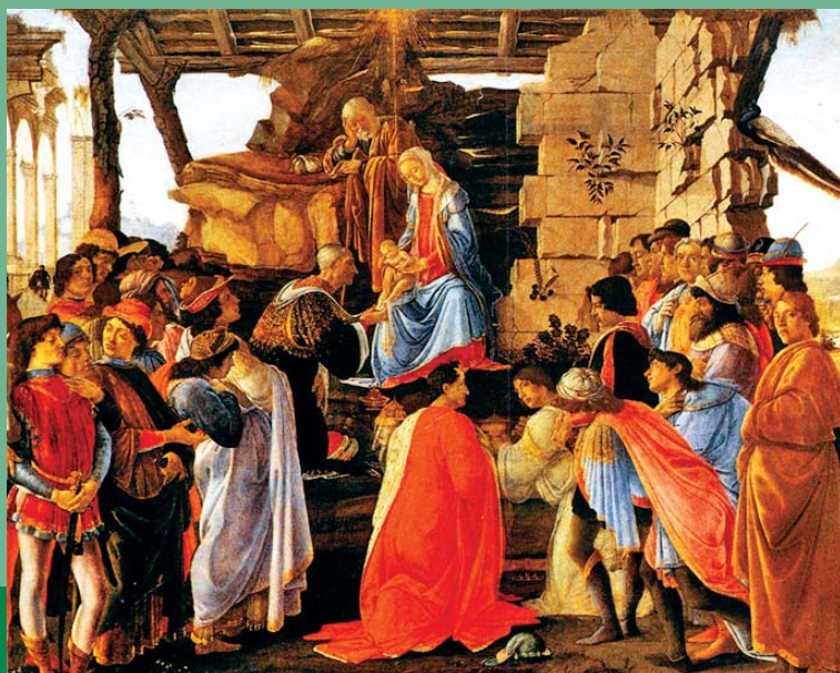
Botticelli: A háromkirályok hódolása (1475.)