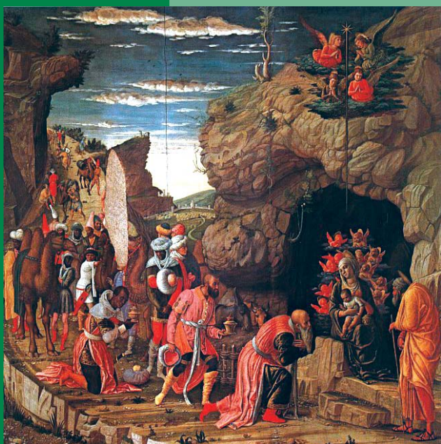
Mantegna: Királyok imádása (1462.)