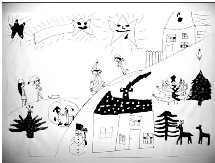
Léta Judit rajza

nítójuknak nagyon gyorsan kellett menniük, hogyha nem akartak megfagyni. Ám kicsi Hans egyáltalán nem bánta a hideget, mert úgy érezte a csillagok egyenesen rámosolyognak, olyanok voltak, mint sok gyémánt, amit egy mély kék baldachinra helyeztek. Minden egyes csillag csillogott és világított a sötétben. A hó szikrázó volt, és Hans azon tűnődött, hogy vajon a csillagok látják-e magukat visszatükröződni az apró, egész földet betakaró hókristályokban.