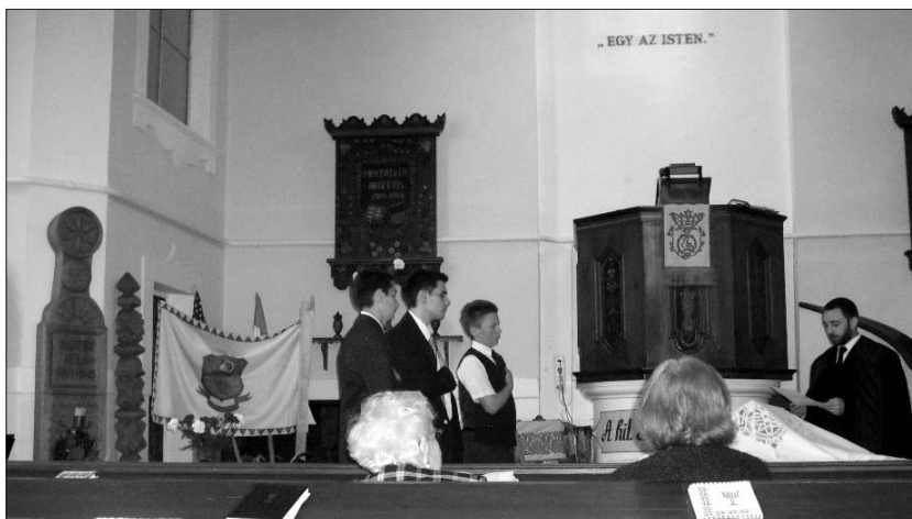
Konfirmáció 2009. május 24-én

Május 31-én és június 1-én, Püskösd mindkét napján ünnepi Istentiszteletet tartottunk és