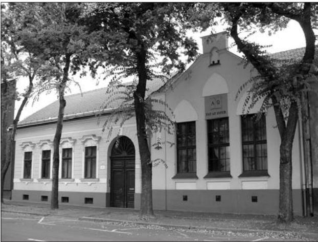
Debreceni templom és lelkészi lakás

Az eddigi legnagyobb feladatot a Hódmezővásárhelyi templom felújítása jelentette, elsősorban annak nagysága és lepusztult állapota miatt. A korábbi években a lelkészi lakás épület tömbjének teljes tetőszerkezetét az egyházközség átépíttette az önkormányzat támogatásával, az Egyház, és a helyi gyülekezet összefogásával, de a templom felújítására nem maradt erő.