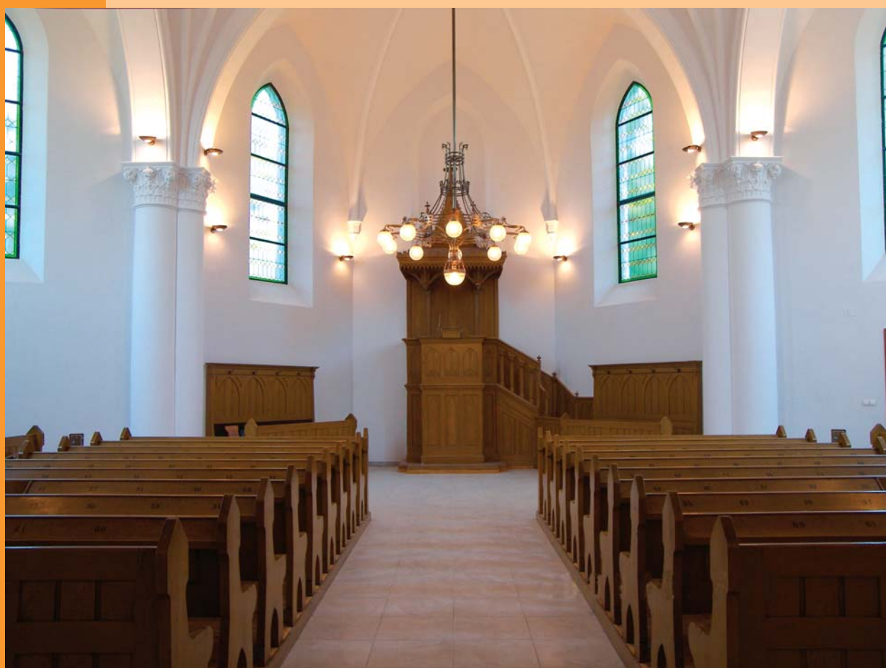
A hódmezővásárhelyi templom felújított belső tere