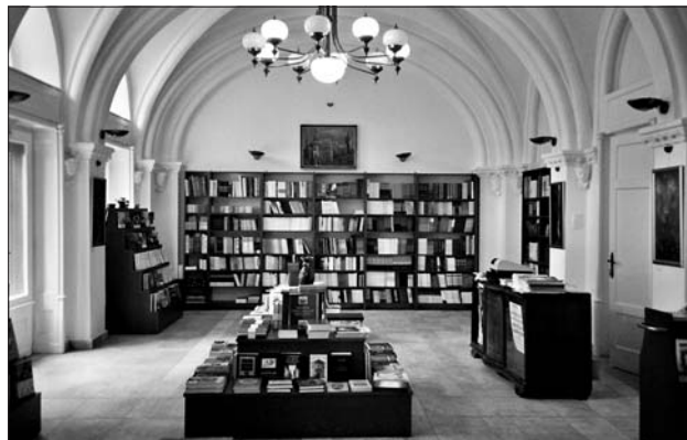
Az új unitárius könyvesbolt

2008–2009. – Hódmezővásárhelyi templom felújítása.