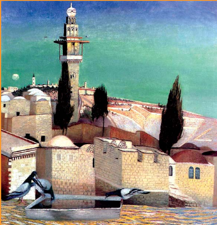
Csontváry: Az Oljafák hegye Jeruzsálemben (1905)

Kéthavonta megjelenő folyóirat · 2009. május–június · 63. évfolyam 3. szám