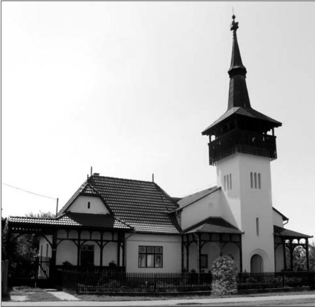
Kocsordi templom és lelkészi lakás