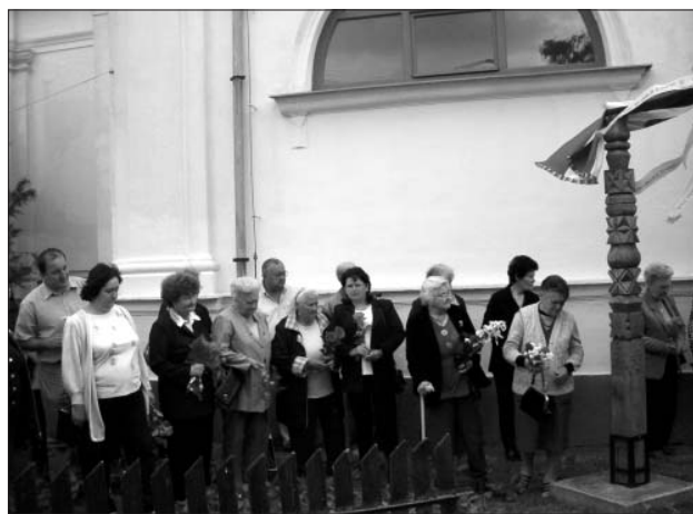
Koszorúzás a kopjafánál

Június 4-én , csütörtökön délután 5 órakor megemlékezést tartottunk a templomban a gyászos trianoni diktátum 89. évfordulója alkalmából. Előadásom mellett gyönyörű alkalomhoz illő versek, énekek hangzottak el dalárdistánk, szóló énekeseink, verselőink előadásában. Az emlékestentisztelet után a templomkertben megkoszorúztuk a „Nem, Nem, Soha” trianoni kopjafánkat, és elénekeltük a Nemzeti Imádságot és a Székely Himnuszt.