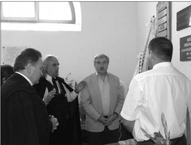
Az emléktábla avatása