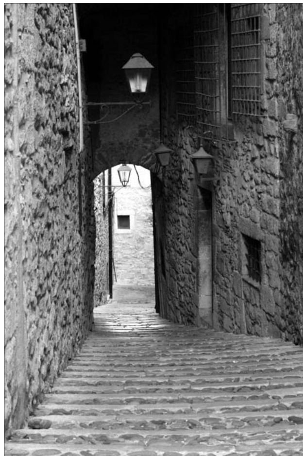
Sikátor a gironai call mélyén

Nem érdemes elmélyednünk a teológia szörszálhasogató kérdéseiben, melyek nagy részét ma már nem is értjük. Legyen elég, hogy Socinus szerint lehet Jézust imádni, hiszen az Atyaisten jobbján trónolva, Fiúként uralkodik. Dávid viszont egy jottányit sem enged. Jézust imádni nem szabad, állítja, mert a bibliai szövegekből kiderül, hogy miután feltámadott és a mennybe emelkedett, küldetése – egyelőre – véget ért, várja az utolsó ítéletet, midőn visszatér, ítél az emberiség felett. (Dávidék és Péchy Simonék remek héber tudása is lehetővé tette, hogy másképpen értelmezzék a szent szövegeket, mint elődeik. Például a „Szent, szent, szent az Úr, a seregek Istene” sort – Izaiás 6. –, melyet korábban háromszor szentként, a Szentháromság kifejezéseként is értelmeztek, ők egyszerűen a héber felsőfoknak tekintették, és „legszentebb seregek Ura”-ként fordították.) Dávid tehát tiltja, Socinus nem ellenzi, Blandrata pedig megköveteli Jézus imádását. Utóbbi pedig le akar (és le is fog) számolni mindazokkal – elsősorban az unitárius püspökkel –, akik az új