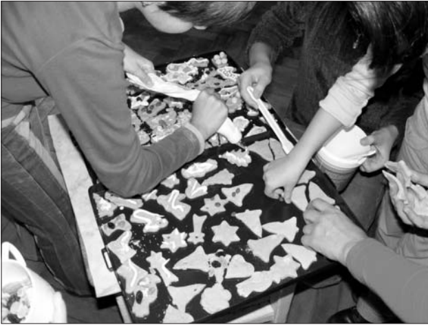
Advent – mézeskalácssütés

Krisna-hívók gyakorlata, a Szim Salom Progresszív Zsidó közösség rabbinójének elmélkedése.