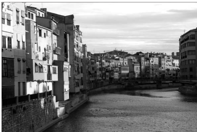
Girona, az Onar folyó partja