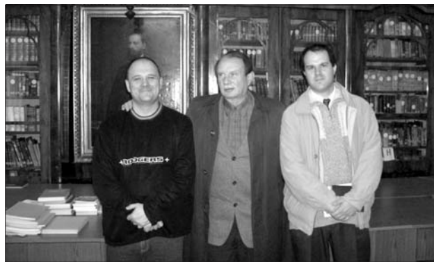
A helyi csoport életrehívása a miskolci unitárius gyülekezeti teremben