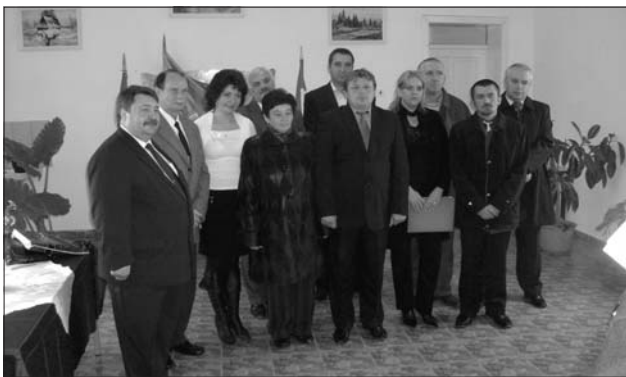
Az őszi kárpátaljai szavalóverseny zsűrije, a somi iskolavezetés és a polgármester