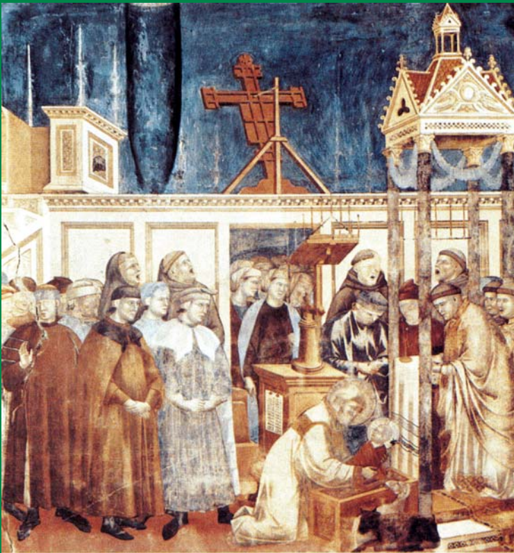
Giotto: A greccói betlehem (1300 körül)

Kéthavonta megjelenő folyóirat · 2009. november–december · 63. évfolyam 6. szám