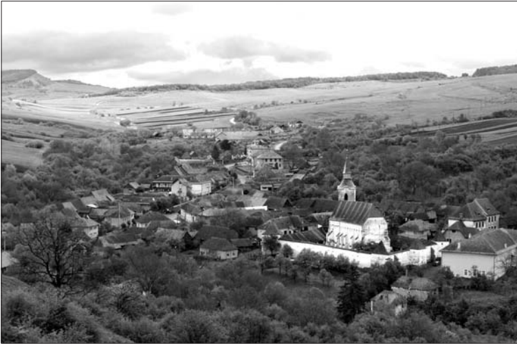
Székelyderzs, falu és unitárius vártemplom

a középkori magyar királyság kormányzatának folytatása. A magyar királyi tanács az erdélyi fejedelmi tanácsban él tovább, a magyar királyi kancellária pedig a fejedelmi kancelláriában.