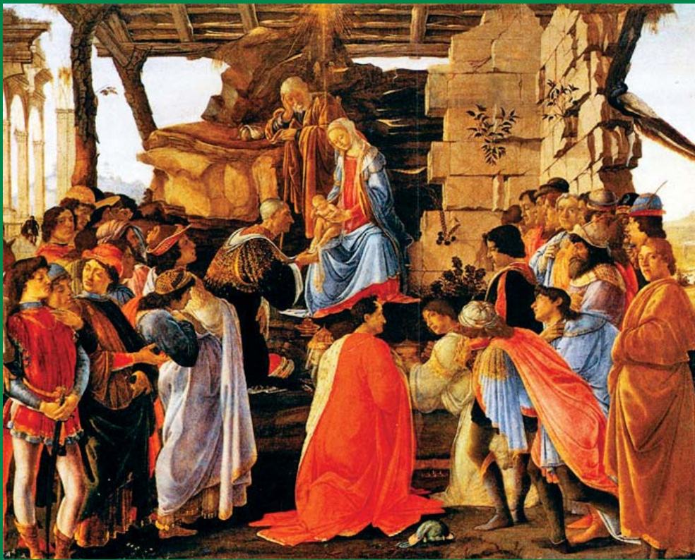
Alessandro Botticelli (1445–1510): A háromkirályok hódolata

Kéthavonta megjelenő folyóirat · 2010. november–december · 64. évfolyam 6. szám