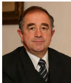
Az Erdélyi Unitárius Egyház

Elhangzott 2012. január 8-án, a Budapesti Unitárius Egyházközség Nagy Ignác utcai templomában az 1568. január első felében ülésező Tordai Országgyűlés által meghozott ediktumra emlékező istentiszteleten, amit a Kossuth Rádió élőben közvetített.