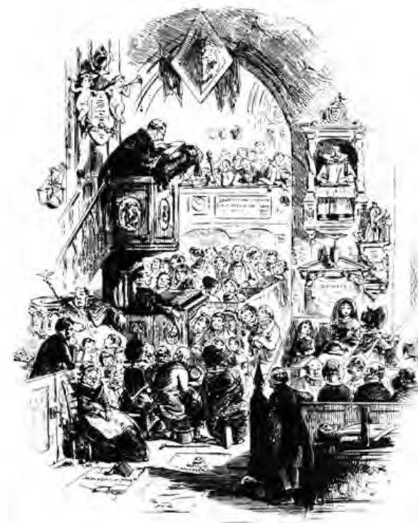
Hablót Knight Browne (1815-1882) egy illusztrációja, az első David Copperfield kiadásból. A művészt 25 évig dolgozott Dickens-el együtt Phiz művésznéven. Az író tíz művéhez készített illusztrációkat.