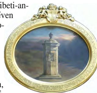
A dardzsilingi síroszlop festménye, gróf Széchenyi István keretbe vésetett szövegével

1842 februárjában megkísérelte a Lhaszába való eljutást. A Mahananda folyó mocsaras, egészségtelen éghajlatú vidékén maláriát kapott. Március 24-én megérkezett Dardzsilingbe. Április 4-én súlyos rohamok és láz kínozták. Április 11-én, reggel 5 órakor Károly Csoma Sándor földi élete véget ért. Másnap a dardzsilingi európai temetőben helyezték végső nyugalomra, a Himalája harmadik legnagyobb csúcsa, a Kancsendzönga árnyékában.