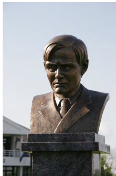
Balázs Ferenc mellszobra Lakitelken

kedésének bemutatása mellett sort kerítettünk az egyetlen unitárius szellemiség kulturális lap, a Partium bemutatására, mely nagy sikert aratott, új érdeklődőket megnyerve ügyünknek. Ezzel is erősítettük Balázs Ferencnek, lelki és szellemi példaképünknek hagyatékát.