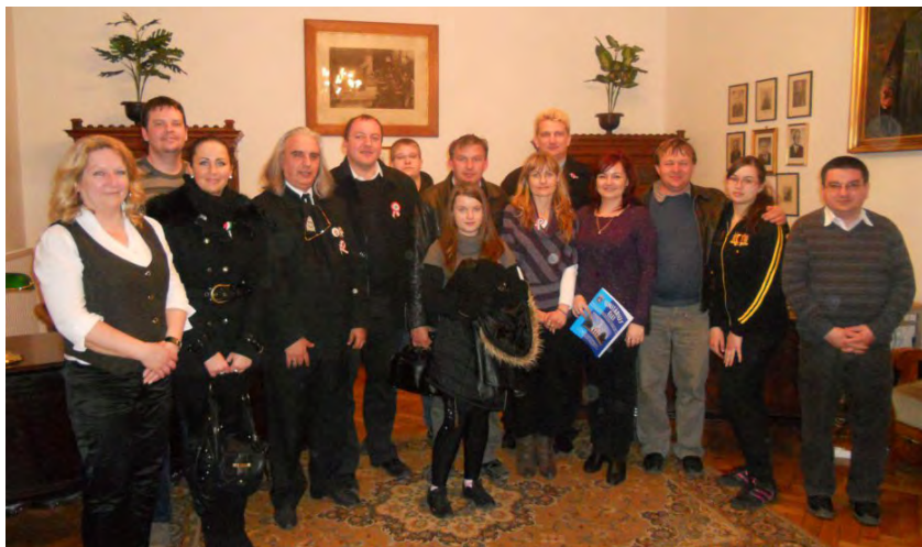
Füzesgyarmati polgármesteri látogatás a püspöki hivatalban március 15-én.