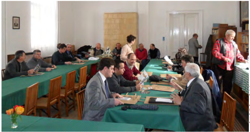
Részvevők az Unitárius Lelkészek Országos Szövetségének hódmezővásárhelyi munkaértekezletén.