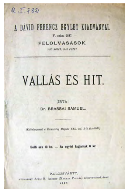
Brassai Sámuel egyik időskori teológiai írása, Vallás és hit címmel

1871-ben az Egyházi Főtanács felkérte Brassai Sámuel, hogy – Jakab Elek társaságában – vegyen részt a brit unitáriusok londoni közgyűlésén. Brassai vállalta a fárasztó és költséges utazást – költségeinek részleges pótlására csupán 100 forint hozzájárulást kért. Londonban Brassai angolul, míg Jakab latinul tartott előadást,