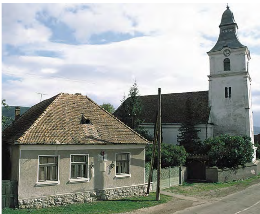
A torockószentgyörgyi unitárius templom, mellette a paplak, Brassai Sámuel szülőháza

A jövő vallása című, 1886-ban tartott felolvasása, amelyben kifejtette: „az a vallás tarthat leginkább számot a művelt világ kedvezésére, amely az általános kereszténységben gyökerezve ez idő szerint legtisztább (...) az unitarizmus vagy mondják nevével: az unitáriusok vallása.” Brassai Sámuel képes volt arra, hogy tiszta keresztény hitét és az unitarizmus iránti elkötelezettségét összeegyeztesse mindazokkal a természetudományi, filozófiai és művészeti irányzatokkal, amelyekkel hosszú életpályája során foglalkozott. Boros György tanítványi szeretettel megírt visszaemlékezése szerint Brassai Sámuel hit- és életelvei közül a legfontosabbak az alábbiak: „Ragaszkodj ahhoz az igazsághoz, amely egyesít, és tartsd távol magad attól a szeszálhasogató okoskodástól, amely eltávolít. Bízál Isten szeretetében, és támaszkodj az egységére, melyet a világmindenségben oly tökéletesen valósít meg. Legyen hited a te meggyőződésed szerint, de szeretettel ölelj magához mindenkit (...) Kövesd Jézust és boldog leszel.”