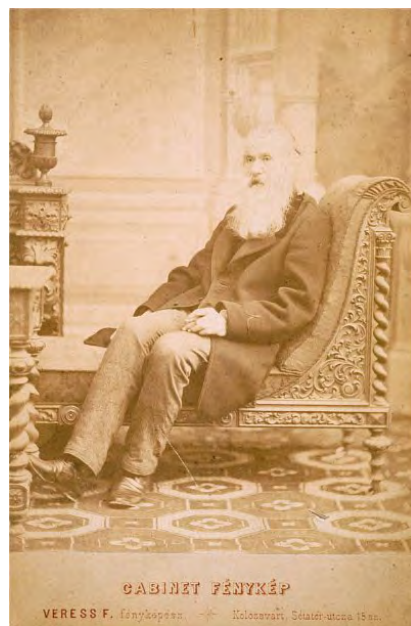
Brassai Sámuel 1880 körül

Túlzás nélkül állítható, hogy Brassai Sámuel beleszületett az unitarizmusba, a hétköznapi és ünnepeken is tudatosan vallott és megélt dávidferenci hitelvekbe,