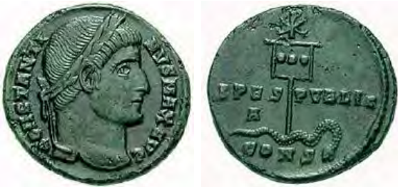
Konstantin 337-ben vert pénzérméje a Krisztus monogrammal

császár személyes politikai céljait is. 7,16 Az azonban vitathatatlan, hogy a császár megtérése az egész nyugati civilizáció és a kereszténység fejlődését máig meghatározó tényező maradt.