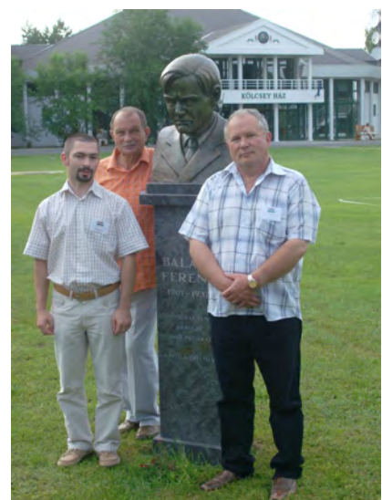
A beregi szórvány delegáció Lakitelken

ifjúsági vezet is egy presbiter, s a gazdasági ügyintéző (könyvelés, pénzbeszédés) is presbiterként ténykedik. Lényegében a beregi szórvány hat fős vezet ségben áll (természetesen nincs kizárva olyan átfedés sem, hogy egy személy két tisztséget is betölthessen). Végeztül az Értésít a beregi unitárius szórványról ír egy összesítést. Kifejti, hogy a szórvány két ágon tevékenykedik (az eredeti egységes gyülekezet 2005 után két ágra szakadt).