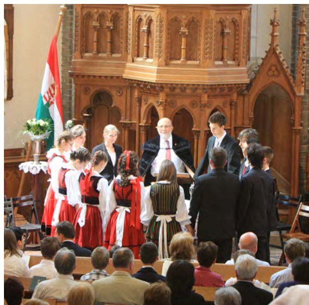
A beszéd elhangzott a budapesti unitárius egyházközségben június 3-án és a pestszentlőrinci unitárius egyházközségben június 10-én.

Életemek elkövetkezendő évtizedeihez jó szárnyalást kívánok! Isten áldjon! Isten veletek!