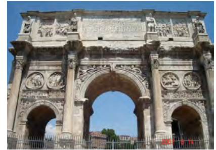
I. Konstantin császár római diadalíve, amelyen Jézus neve nem szerepel.

Sorozatunk a továbbiakban több témakört részletesebben is érint: így először Mária [Magdaléna] Evangéliumával és a Pistis Sophiával, majd a Nag Hammadi Könyvtárral, Tamás valamint Fülöp Evangéliumával és végül, de nem utolsósorban Júdás Evangéliumával foglalkozunk. A sorozat zárásaként megpróbálunk összefoglaló értékelést adni a kereszténység IV-VI. századi paradigma-váltásának okairól és ennek máig ható következményeiről.