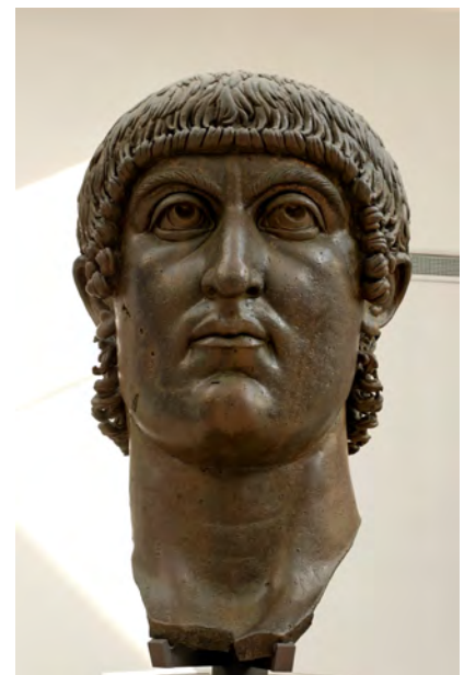
Nagy Konstantin (4. sz., Musei Capitolini, Róma)

Mint a fent idézett Milánói ediktum szövegéből jól látható, a kü