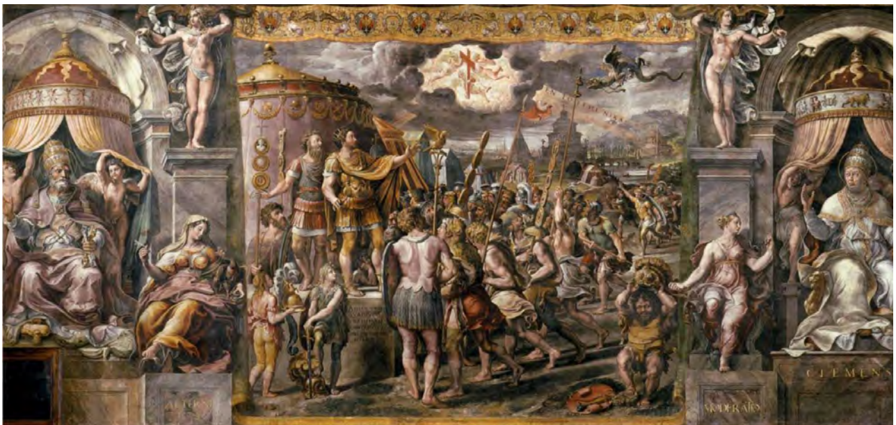
Raffaello Sanzio: In hoc signo vinces, Vatikán

Az egy Isten, egy hit, egy csá- szár, egy birodalom eszmerend- szer kétségtelenül jól szolgálta a