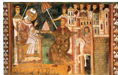
Szilveszter átvései az állítólagos adománylevelet Konstantintól (13. századi freskó, Santi Quattro Coronati, Róma).

A IV. századi valóság ezzel éppen ellentétes volt, I. Szilveszter részt sem vett a niceai zsinaton, amit a császár hívott össze. 7,8 A dokumentum valódiságát Lorenzo Valla, olasz katolikus pap és humanista cáfolta meg 1440-ben latinul írt m vében: „Értekezés a hamisított és tévesen igaznak tartott konstantinuszi adománylevélér I” (Mainz, 1518).