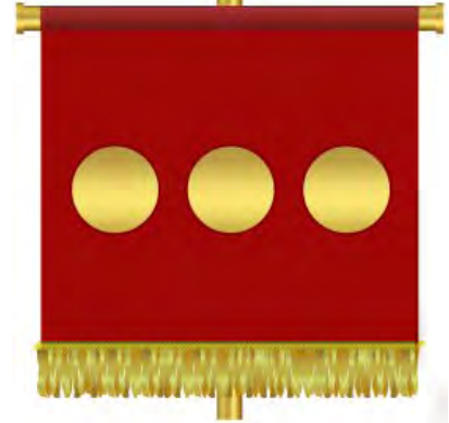
Nagy Konstantin labarumja (római harci zászló).

A császárt Eusebiosz keresztény történetíró szerint a 312. október 28-án lezajlott Milvius-hídi csata el tt anyja Szent Ilona, aki buzgó keresztény volt, felkereste a táborban, és arra intette, hogy kérje az Úr segítségét a gy zelemhez. Constantinus elutasította anyja kérését, éjjel azonban álmot látott. Egy nagy kereszt t nt fel az égen, ezzel a felirattal: "E jelben gy zni fogsz!" (Latinul: In hoc signo vinces. Görögül: [tuto nika].) Constantinus másnap felvarratta a kereszt jelét katonái ruhájára. A labarum csücsújára pedig a római sas helyére aranykoszorúba foglalt, drágaköves Krisztus-monogram került. (A görög " [christos] szó els két bet je: X = khi, P = ró.) Ezt követ en véres ütközetben legy zte Marcus Aurelius Valerius Maxentius háromszoros túler ben lévő seregét. Ezzel a gy zelmével lett Nyugaton az úr.