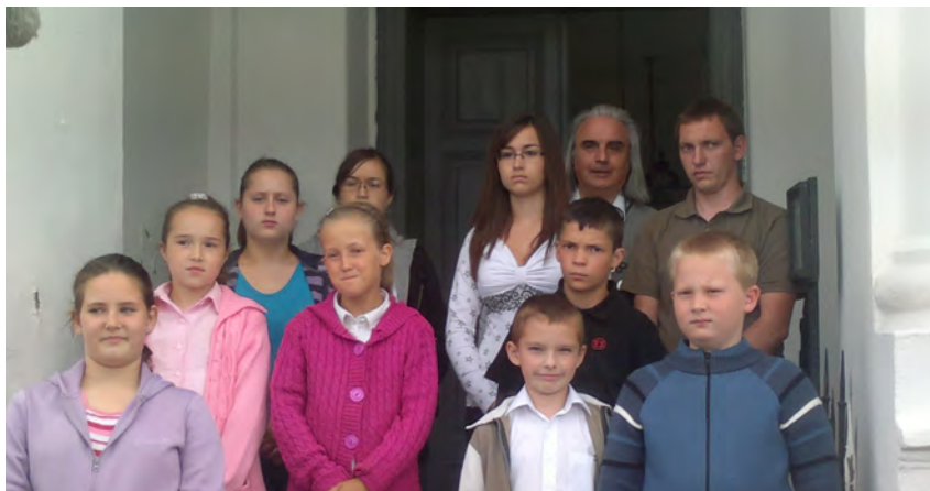
Fenti csoportkép a június 17.-én tartott hittanos évzáró után készült.

ni. A fárasztó munka szép eredményt hozott, mert a június 24-i bemutató után rengeteg elismerést kapott a „Ki volt dicsőbb, ki volt nagyobb?” című, egyházi nagyjainkat idéző produkciónk.