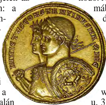
I. Konstantin 313-ban vert érméje a római vallás napistenével

A korábbi politikai helyzetet jól jellemezi, hogy Kr. u. 308-ban Konstantint is beleértve hat „ural- kodója” volt a birodalomnak: 3 ke- leten és három nyugaton(!). Az is kétségtelen, hogy a júdaizmuson túlmen en legalább három monote- ista vallás volt még jelen az akkori birodalomban: a kereszténység (szám- arányát 5-8%-ra be- csülik) és két napkultusz: a Sol Invictus (gy zedel- mes nap) vallása – ami a császár korábbi vallása – volt és a Mithrász-hit. Ez, talán nem meglep mő- don, biztosított bi-