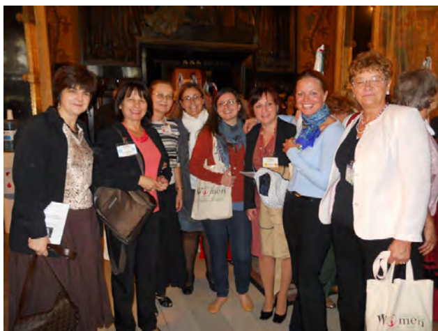
Magyarországi résztvevők egy csoportja. (A szerző balról a harmadik.)

2012. október 4-e és 7-e között a székelység fő városában, Marosvásárhelyen jártam a budapesti Bartók Béla Egyházközség Perczelné Kozma Flóra N. egyletét képviselő hivatagú delegáció tagjaként, hogy részt vegyek az unitárius, unitárius-univerzalista és más felekezetek második