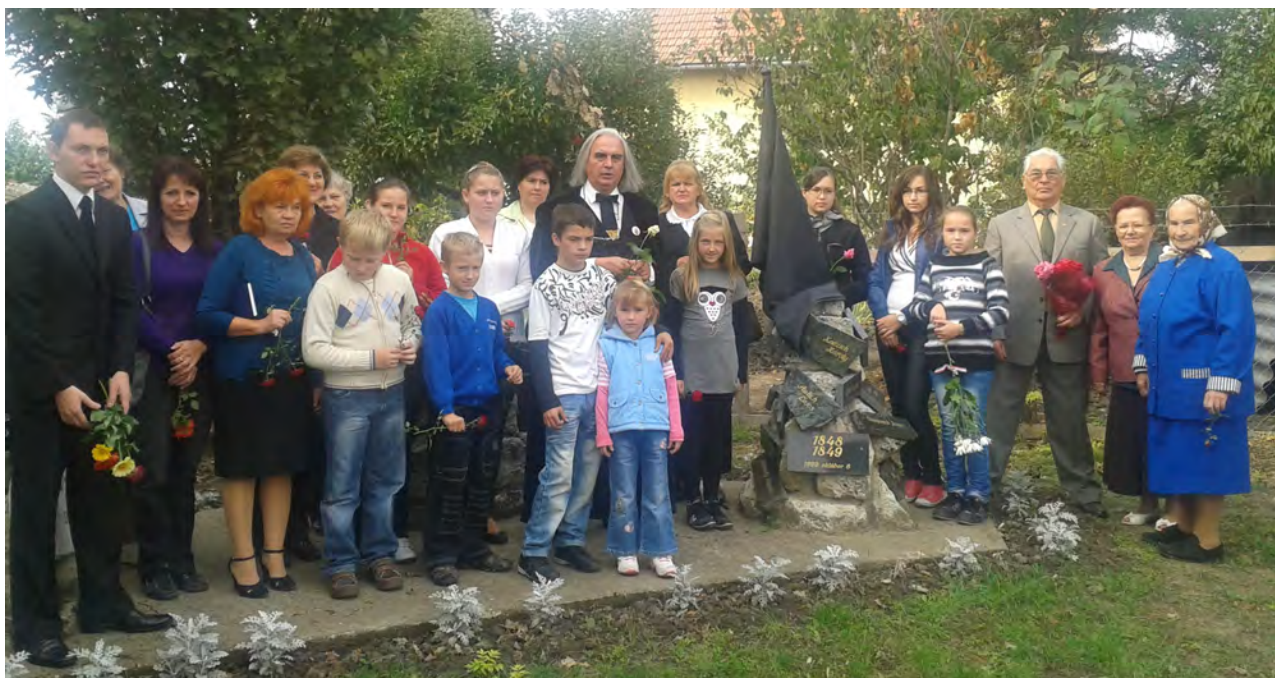
Füzesyarmatiak az október 6-i megemlékezésen

Novemberben még sok alkalom lesz mind vallási mind társadalmi életünkben, amelyeknek megtartásához, megszervezéséhez kérjük a minden áldások adójának, Istennek segítségét.