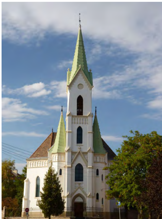
A 36 méter magas, karcsú torony

a díszeket, némelyiket újra is öntötték. Megújult a négy szalugáteres ablak és a bejárati ajtók is. A templom körül járda épült.