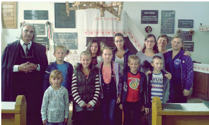
Hittanos évnnyitó: hittanosok, szeptember 17-én