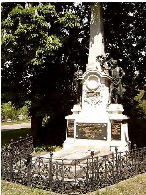
Thék Endre síremlékét a Miniszterelnökség Nemzeti Emlék hely és Kegyeleti Bizottsága 2012-ben a Nemzeti Sírhely részévé nyilvánította.

2009-ben Orosházán létrehozták a Thék Endre-díjat.