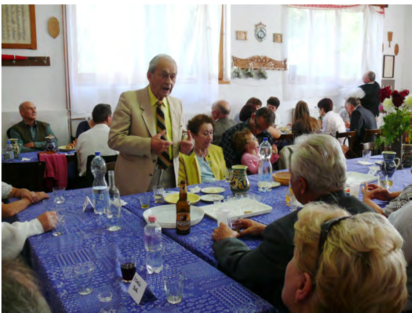
„Szót kért és kapott e sorok írója is...”

Szót kért és kapott e sorok írója is, aki elmondta, hogy Homoródbászfalván töltötte gyermekora egy részét, az pedig szomszédfalú Homoródalmással, tehát földiek-rokonok vagyunk, és jóles az érzés a találkozás egy ilyen napon, amikor Istennel, közös hazával és hasonló gondolkodású unitárius magyarokkal vagyunk, lehetünk együtt. Méltatta a Bodorék kezdeményezését, teljesítményét és a békés-baráti légkör fontosságát.