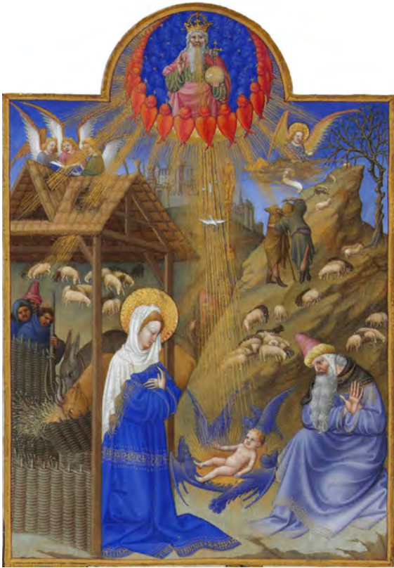
A születés. Illusztráció Les Très Riches Heures du Duc de Berry (Berry herceg imádságai) című, 15. századi francia kéziratból Musée Condé, Chantilly, France

A legtöbb, a közelmúltig él, gyönyörű biblikus népi hagyomány elbeszéli Jézus születését. A Parasztbiblia* csakúgy, mint a fent idézett népköltési székely vers is, ha nem is adja meg az évszámot, de legalább utal az évszakra. Az A.D. (Anno Domini, azaz „az Úr évében”) vagy B.C. (Before Christ) megjelölés viszont csak akkor válik fantáziánk megmozgatójává, ha kiderül, hogy Jézus nem születhetett Kr.e./Kr.u. „0”-ban, amint ezt a keresztény idősámítás sugallja. Több okból sem. A különböző szerzők véleménye abban sem teljesen egységes, hogy miért nem volt „0.” év, azaz helyette csak Kr.e. 1./Kr. u. 1. évfordulója. 1,2,3