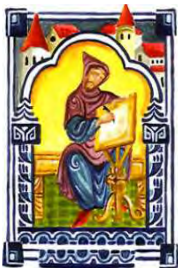
Szerzetes a skriptóriumában Dionüsziosz korában. Ismeretlen eredetű középkori kéziratból.

Ennek ellenére a történeti Jézus felidézése nem hiábavaló próbálkozás, mert segít megérteni Jézus működésének és tanításának társadalmi közegét. A bibliai, történeti-régészeti és csillagászati adatok összevetéséből Jézus születésének leginkább valószínűsíthető dátumaként a Kr. e. 5. év adható meg. Ebből az is világos, hogy Jézus egy történelmi fordulópont közelében született és gyermekkorának legalább is egy részét már egy római provinciává vált Júdeában élte meg.