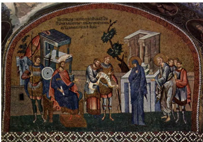
Mária és József feliratkozik az adózási összeírásra Quirinius helytartó előtt (Bizánci mozaik, Kr. u. kb. 1315, Kahré dzsámi, Isztanbul)