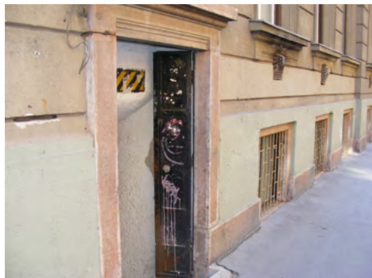
KIADÓK lakások 70-100 nm között, az V. ker. Nagy Ignác u. 2-4 sz. alatt. Érdeklődni lehet az egyházi központban!