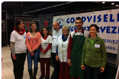
Fent: a segélyszervezet és CBA alkalmazottak egy csoportja

Ajánljuk egyházközségeinknek és a nőszövetségeinknek, hogy szervezzenek a mostanihoz hasonló adománygyűjtési akciókat, együttműködésben helyi boltokkal, mellyel sok rászoruló emberen tudnak segíteni.