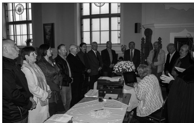
Tisztújítás a Bartók Béla Unitárius Egyházközségben

nek az egyházközségünkben és az egyházáért végzett munkát, kérve Istent hogy tartsa meg jó egészségben.