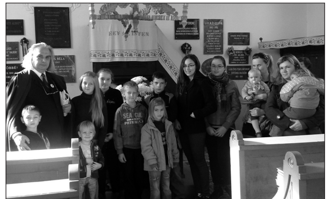
A hittanosok csoportja

December 1-jén meggyűjtöttük az adventi koszorú első gyertyáját templomunkban és a helyi Hajnal István Idősek Otthonában. Délután részt vettünk a városi adventi ünnepségen, a református templom előtt felállított betlehemnél beszédet mondtam, majd a három felekezet lelkésze a polgármesterrel közösen meggyűjtötte az adventi gyertyát.