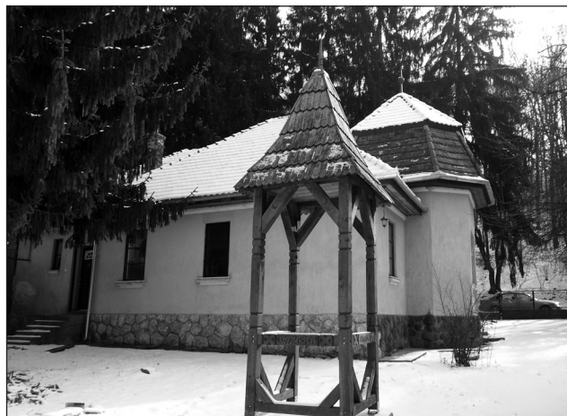
A magyarokúti Fenyőliget Vendégház