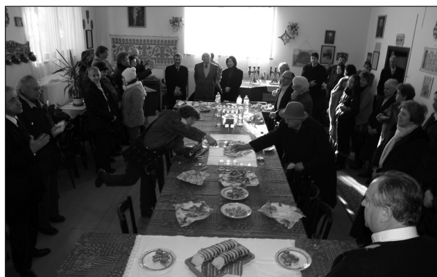
Szeretvendégség a gyülekezeti teremben

Élénken élnek még emlékeinkben a tavalyi karácsony képei, hangulata, s alig hisszük el, hogy közben máris eltelt egy újabb esztendő, az ünnep hangulata ismét benne van már a levegőben.