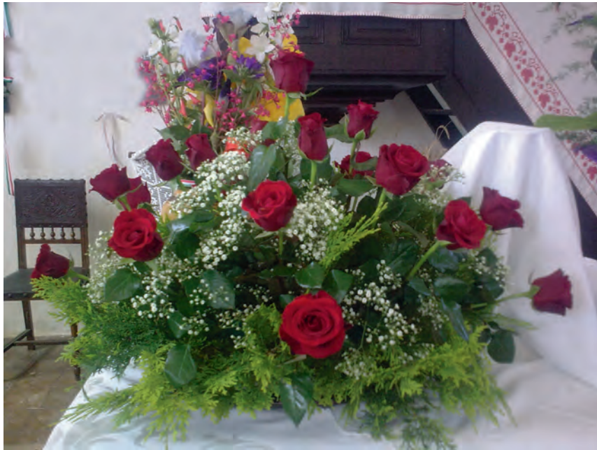
PüNKÖSDI megterített úrasztala Füzesgyarmaton

Kéthavonta megjelenő folyóirat • 2013. március–június • 67. évfolyam 2-3. szám