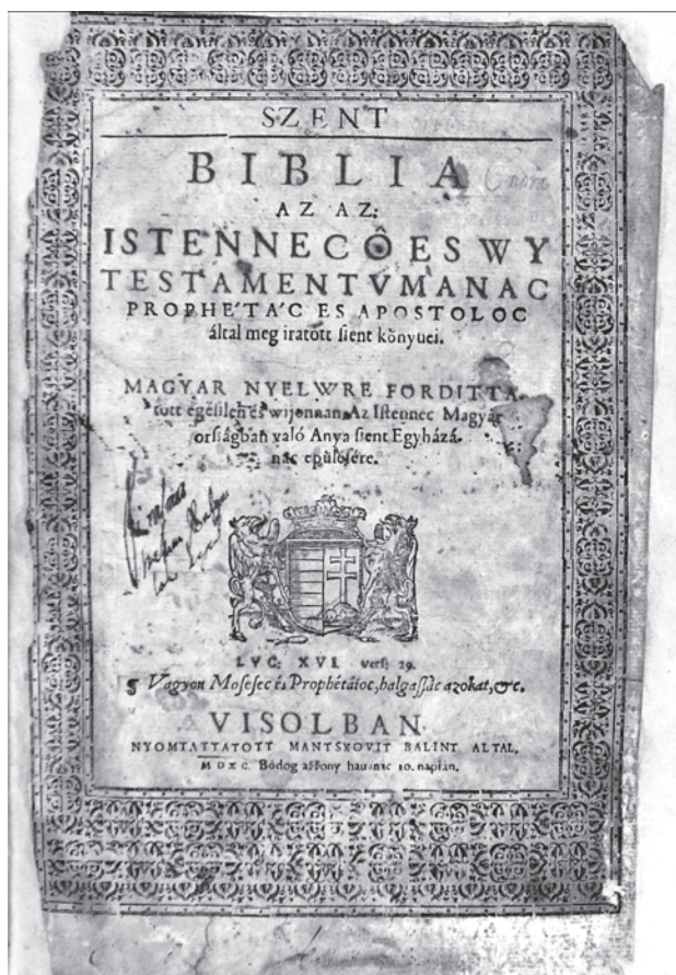
A Vizsolyi Biblia

Jelenits István a Szent István Társulat 1974-es biblia revízióját elemezte. A II. Vatikáni Zsinat szellemében ez az új magyar fordítás már nem a latin Vulgata szövegére épült, hanem eredeti (ógörög és masszoréta héber) nyelvű szövegeket vett figyelembe. A szűkös anyagi keretek azonban behatárolták a kiadás lehetőségeit, a fordításban csak 7 személy vett részt, míg az 1955-ös új francia fordításban például 33 bibliai szaktudós. A nyelvhelyességi szempontok érvényesítésére sem került teljeskörűen sor, például az első ószövetségi