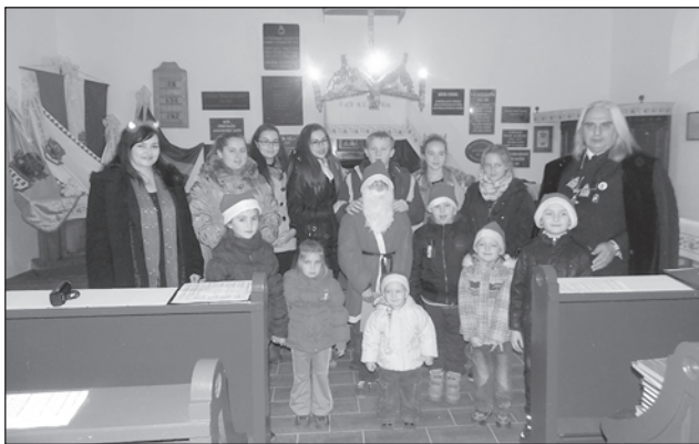
A Mikulás napi rendezvény résztvevői

nincs az egyházközségnek, mivel a gyűjtést, az odaszállítást a szövetségünk díjmentesen végzi. Eddig öt lelkész válaszolt megkeresésünkre, várjuk még újabb jelentkezését ez ingyenes, hasznos akcióra.