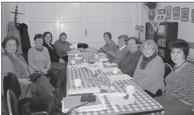
A Nőszövetségi Önképzőkör tagjai