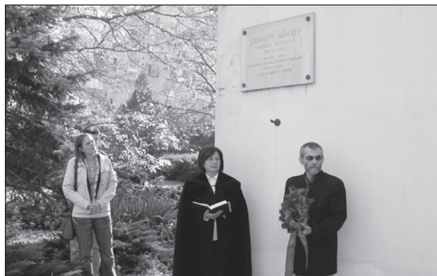
Koszorúzás a Szervét Mihály emléktáblánál