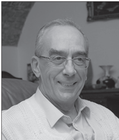
Visy Zsolt régészprofesszor

Énlaka megismerésének van egy családi indíttatása is, az egyik szomszéd faluból, Felsősófalváról származott az egyik nagyanyám, ott élnek rokonaim a mai napig is. Szakmailag pedig azért kötődtem ehhez a tájhoz, mert római koros régészként már hallgató koromban foglalkozni kezdtem dáciai kutatásokkal, a „magyarországi dák leletek” volt a szakdolgozatom. Tehát már 65 nyarán jártam Erdélyben egy gyakorlat-félén Constantin Daicoviciu vezetésével. Több dák vár ásatásán is részt vehettem. Aztán, amikor 2006-ban rászántam magam, hogy vegyek egy házikót, Énlakára esett a választásom, mert az egy meghittebb környezetben helyezkedett el, mint nagyanyám szülőfaluja, sajnos és szerencsére egy olyan fejlettségi szinten, mintha száz évvel ezelőtt élnénk. A határában van egy castellum is, ami egy régész számára eggyel több kihívást jelenthet. Dacia