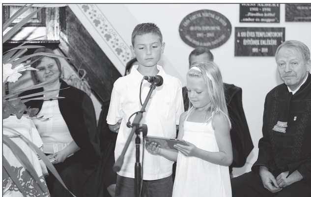
Az ifjak köszöntik az alföldi búcsú résztvevőit

délyi Szövetség vezetőségi tagja tartotta. Mélyenszántó beszéde az összmagyarság „egyistenhitéről” szólt.