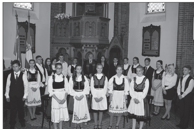
A konfirmálók csoportja