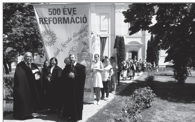
Az alföldi búcsú résztvevői az unitárius templomba vonulnak