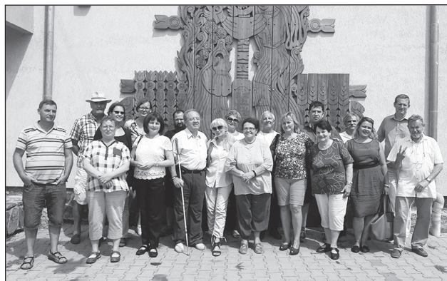
Magyarországi unitárius csoport a szejkefűrdői találkozón