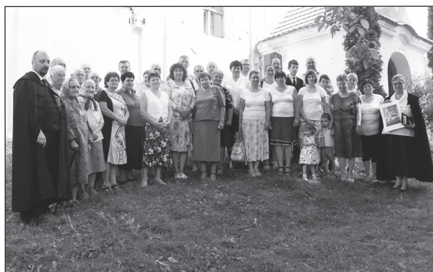
A kocsordi és kénosi unitárius gyülekezetek találkozása