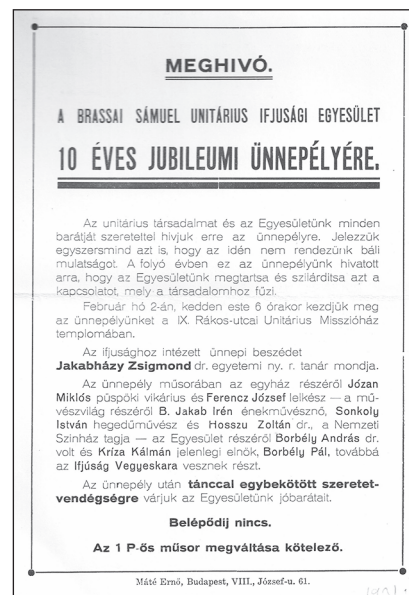
A Brassai Sámuel Egyesület 10. születésnapi ünnepségének meghívója