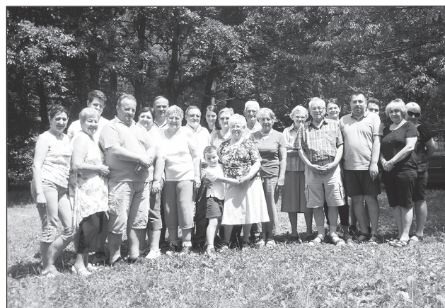
A gyülekezeti találkozó résztvevői