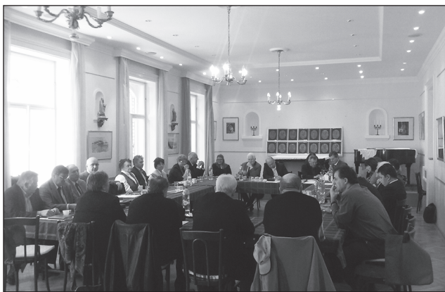
Pillanatkép a közgyűlésről

minden formális és informális alkalmat megragadtak annak érdekében, hogy felhívják a döntéshozók figyelmét a templomos ingatlanunk felújításával kapcsolatos támogatási elvárásunkra. Ennek ellenére nem kerültünk be a kedvezményezett egyházak körébe, ami óriási csalódást jelentett az egyházkerület elnöksége számára. Úgy érezzük, kimaradtunk egy soha vissza nem térő lehetőségből, ráadásul úgy, hogy minden szempont támogatásunk indokoltságára mutatott.