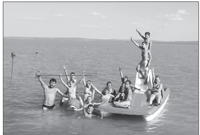
A tábor résztvevői

Jutott idő a mókának, a gyurmázás alkalmával, esti mozi ideje alatt, de alkottunk, tornásztunk, számháborúztunk, cetliztünk, vetélkedtünk, ping-pongoltunk, erdei túrán voltunk és természetesen kihasználva a nyár utolsó meleg napsugarait és a meleget enyhítő Balaton vizét, strandoltunk is.