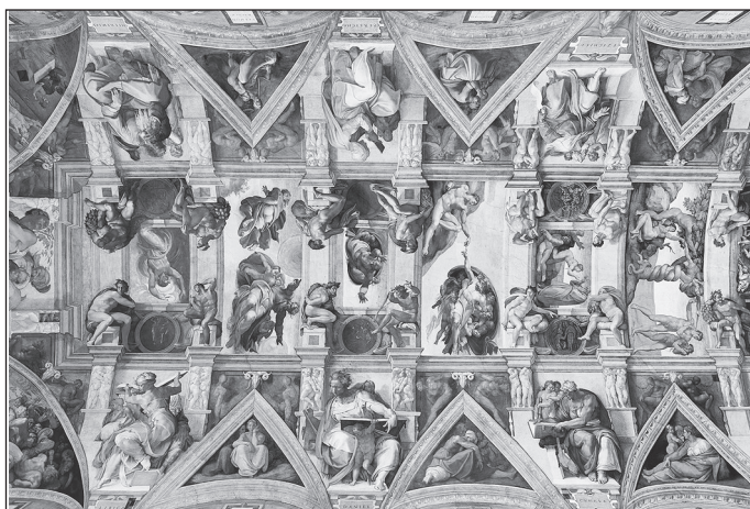
Michelangelo: A Sixtus-kápolna mennyezetfreskója

Ebben a leírásban két csoda szerepel. Nem számoztam külön, hiszen egymást követően vitte végbe Isten rendezői elképzelését. A rendezés ebben az esetben szó szerint értendő, amikor külön hangsúlyt adhatunk napszakunk határozott idejének. Az első, amikor Isten elválasztotta a világosságot a sötétségtől. Ettől a pillanattól kezdve van nappal és létezik éjszaka. Azóta, ami ettől eltér, csodának bizonyul. Személyesen nem jártam az Északi- vagy Déli sarkon, de tudom, hogy meghatározott időszakban teljes a sötétség, vagy éppen éjszaka is világos van. Az ott élőknek ez már nem csoda, hiszen megszokták a jelenséget, viszont sokkal nehezebb azoknak, akik átmenetileg döntenek úgy, hogy kipróbálják a föld eme területének „ csodáját ”. Arra nem gondolhat senki, hogy az ószövetségi leírás