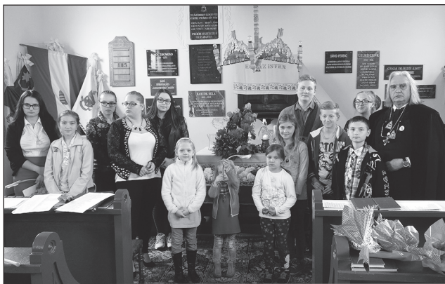
Az anyák napi ünnepség „szereplői”

már 28 éve rendszeresen járunk az otthonba és a településen is sikeres szociális munkát végzünk) Békéscsabára, minisztériumi kiküldöttel tartott fórumra és beszélgetésre. A megye minden ilyen szociális intézménye képviseltette magát a fórumon.