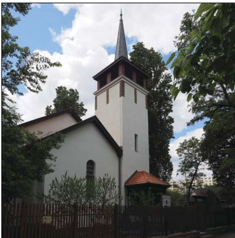
A pestszentlőrinci unitárius templom