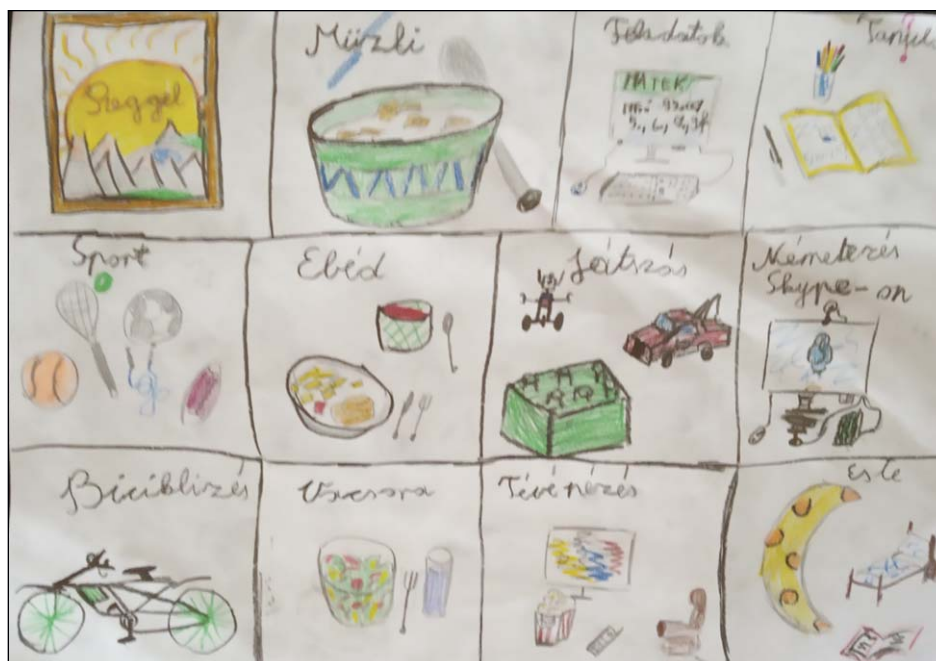
„Egy napom otthon” Oláh Gyula Krisztián 11 év - Érd