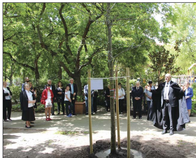
Emlékfa ültetés a Honvéd téren