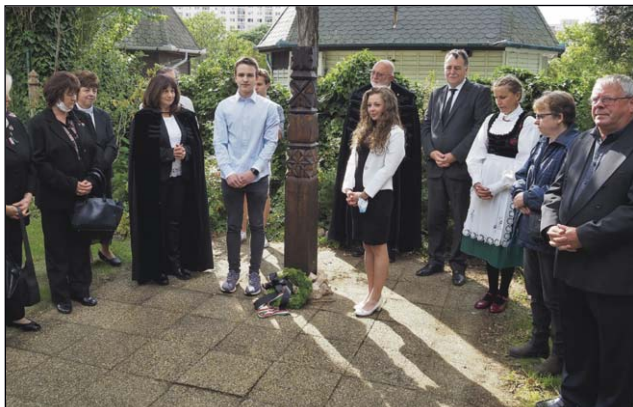
Ünnepi megemlékezés Pestszentlőrincen 2020. jún. 4.

1935. október 3-án került sor az alapkövetételre. 1936. február 19-én volt az első istentisztelet a belül kész, de kívül még vakolatlan templomban. Április 16-án megkezdik a gyülekezeti ház és tanácsterem építését, majd 1936. június 17-én felszentelték a teljesen kész templomot és a hozzáépített gyülekezeti termet. Ekkor 170 család tartozott a gyülekezethez.