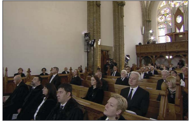
Emlék-istentisztelet a budapesti egyházközségben 2020. június 4.

találták és a kommunista uralom a földjeiktől is megfosztotta őket. A kommunizmus teljes reménytelenségében, kisebbségi elnyomásában haltak meg egy olyan keserű élet után, amelyet mi el sem tudunk képzelni, gyermekeink pedig még nálunk is kevésbé. De ez a keserű élet is tele volt hittel, hiszen valaki, aki két ilyen módon átélt világ- és életéget követően sem adja fel az életet, annak csakis a hit lehet az oka. A hit Istenben, a hazában, a nemzetben, a családban. Nem véletlen, hogy székely ember fogalmazta meg minden idők legcsodálatosabb szállóigéinek egyikét: „ Azért vagyunk a világon, hogy valahol otthon legyünk benne. ” Legyünk még Tamási Áronnál is góbébbak: mi bizony öt országban is otthon vagyunk, ha tetszik másoknak, ha nem. Sőt, otthon vagyunk az egész világban, ahol soha nem kellett szegyenkeznünk magyarságunk miatt, hiszen híres tudósok és művészek ezreivel büszkélkedhettünk, akik miatt csodáltak bennünket, de csodáltak forradalmaink – 1948 és 1956 – miatt is.