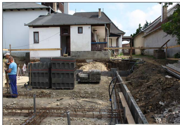
Megkezdődött a kocsordi unitárius központ építése