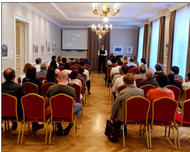
A megújult gyülekezeti terem átadása 2020. június 14-én