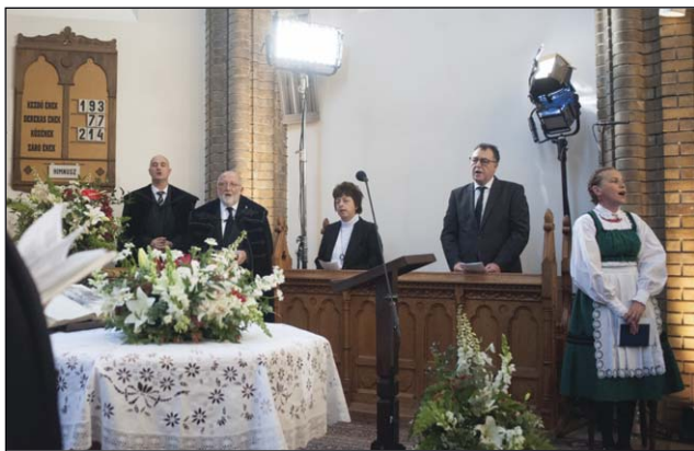
Emlék-istentisztelet a budapesti egyházközségben 2020. június 4.

dott emlékü nagyszüleim és kortársaik a trianoni országvesztésről meséltek unokáiknak. Ők tizenéves gyermekeként szenvedték át a legnagyobb magyar sorscsapást, és életük végéig fátyolossá vált a hangjuk, amikor megosztották velünk a nagybetűs fájdalmat. Azt a veszteségérzetet, ami azóta is minden magyar ember szívében él bizonyos mértékben. Meséltek nekünk az évezredek dicsőséges múltjáról, majd arról, hogy az I. világháború óta sajnos „ Nem úgy van már, mint volt régen, / Nem az a nap süt az égen [...] ” a Kárpát-medencei hazánk felett. Azóta a trianoni merénylet nemcsak sérelmezett statisztikai adatként és igazságtalan történelmi sorsfordulóként fáj nekünk, hanem személyes módon. Ezt a fájdalmat nem történelemkönyvekből sajátítottuk el. Akkoriban az iskolában éppen a fordítottját hazudták nekünk annak az igazságnak, amit családi otthonainkban és vallásórán tanultunk. Ez a fájdalom úgy személyes, hogy benne van minden egyéni és közösségi szenvedés, amit az első világháborútól kezdődően átéltünk. Ennek a fájdalomnak része a háborúkban és fogolytáborokban elhunyt hozzátartozók gyászolása, az árván maradt családtagok szenvedése, a parancsuralmi rendszerek összes rémtette, az 1956. évi magyar forradalom és szabadságharc leverése a következményeivel együtt. A Kárpát-medencében alig van magyar család, amelyet nem érintettek volna személyesen az utóbbi század történelmi tragédiái.