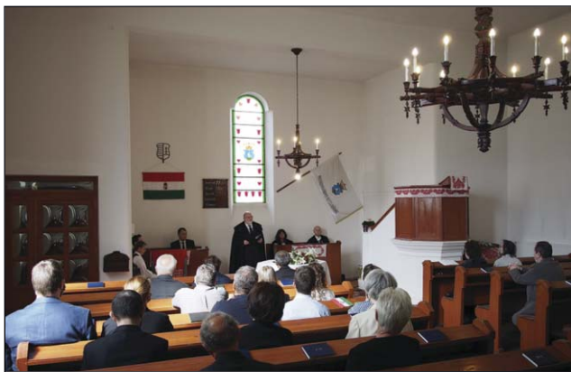
Ünnepi megemlékezés Pestszentlőrincen 2020. jún. 4.

„Igazságot szolgáltat majd valamennyi nép között, ítéletet hoz a távoli, erős nemzetek ügyében. Kardjaikból ezért kapákat kovácsolnak, lándzsáikból pedig metszőkéseket; nép a népre kardot nem emel, hadakozást többé nem tanul.” – olvasható a Mikeás 4,3-ban. Egy volt lőszergyár helyén, ahol a trianoni tragédia nyomán, akik túléltek az első világháborút, a fegyverekből ekevasat és kapát kovácsoltak. Amint letelepedtek, lelki kötelessé-