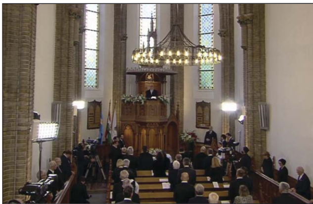
Emlék-istentisztelet a budapesti egyházközségben 2020. június 4.

morú összehasonlító adatok, melyek felsorolását órákon át folytathatnám.