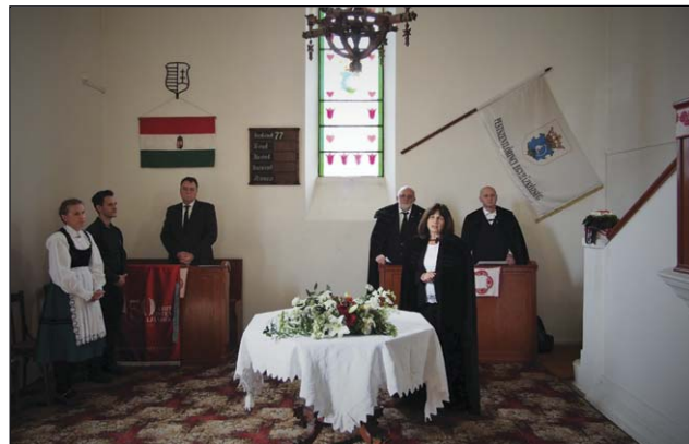
Ünnepi megemlékezés Pestszentlőrincen 2020. jún. 4.