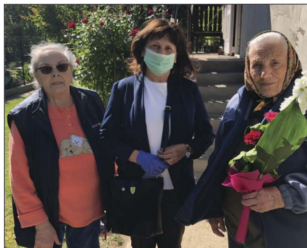
Látogatás az idős híveknél