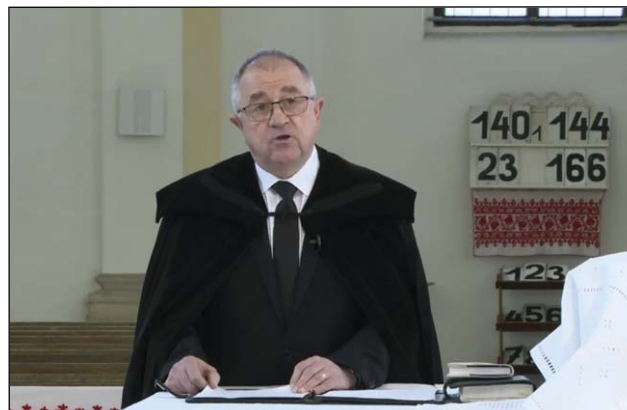
Bálint-Benczédi Ferenc püspök (2020. pünkösöd)

Az evangéliumi leírások, tudósítások alapján képet nyerhetünk arról, hogy a Jézushoz legközelebb álló apostoloknak milyen volt a gondolkodásmódja, hogyan fogadták Jézus tanítását, hogyan igyekeztek mesterük kérése szerint élni, érteni, érezni és tevékenykedni. Az evangéliumban megörökített egy-egy élethelyzet, életkép betekintést enged az ő lelkükbe. Ezek az apostoli életképek, élethelyzetek egy-egy állomás a lelki fejlődés és alakulás, a tanítvánnyá válás útján, ami viszont pünkösöd előtt a teljes kiüresedéshez és csüggedéshez vezet. Árván, kitaszítottan, nincstelenül, kiábrándultan tengetik napjaikat a jeruzsálemi felsőházban. Együtt vannak mind, a saját maguk életével, keserűségével, kiábrándultságával, csalódottságával, félelmével, de húsvét örömeivel is, mérlegelve magukban az ép ésszel oly nehezen felfogható, felkavaró eseményeket. Persze ebben az érzés- és gondolatkavalkádban okvetlenül felmerül az a kérdés is, hogy mi az ő szerepük és feladatuk ebben az új világban.