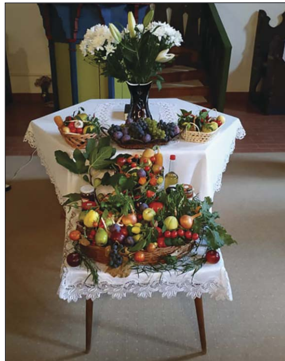
Úrasztala Kocsord - 2020. őszi hálaadás