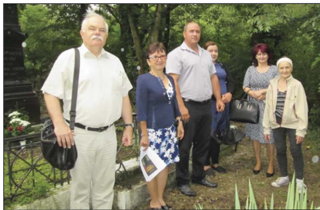
A baracscai temetőben

Tisztelt Polgármester Úr, Alpolgármester Asszony, Igazgató, Lelkipásztor Asszony!