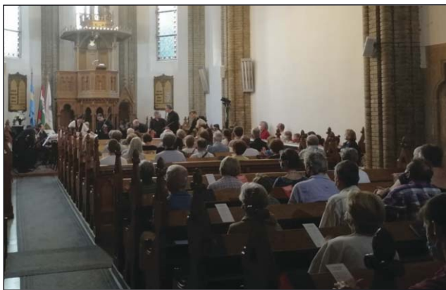
Budapesti Vonósok Kamarazenekar koncertje