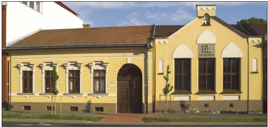
A Debreceni Unitárius Egyházközség imaháza

Templomunkat több mint tizenégy éve közösen használjuk a Keresztyén Testvérek Gyülekezetével, szép példájaként az unitárius toleranciának és annak, hogy a két egyház komolyan veszi a zsolttár tanítását, hogy „...jó és gyönyörűséges, amikor együtt lakoznak az atyafiak...” megtapasztalván az Írás ígértét is, miszerint „...csak ide küld áldást az Ur és életet örökökél...”