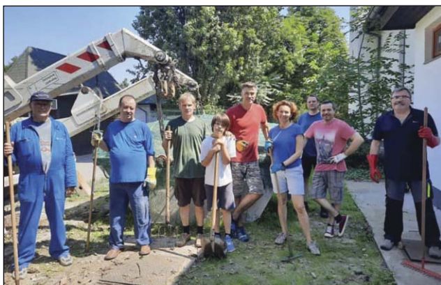
Közmunkázó egyháztagnak a templom kertjében