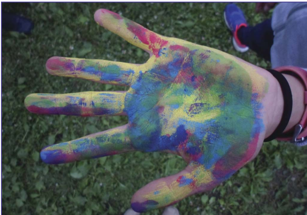
Boldogság – A fotó az Országos Unitárius Hittantáborban készült, készítette Mészáros Nóra.

74. évfolyam, 2020. július–szeptember. 3. szám.