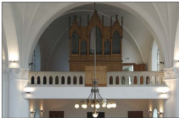
A felújításra váró orgona

az énekek egy részét is sikerült begyakorolni. Természetesen a kikapcsolódás és a közös főzés is emelte táborunk színvonalát.