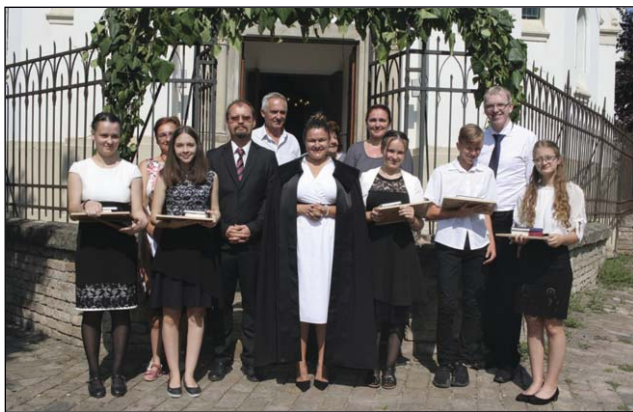
Konfirmáció Hódmezővásárhelyen 2020. szeptember 13.