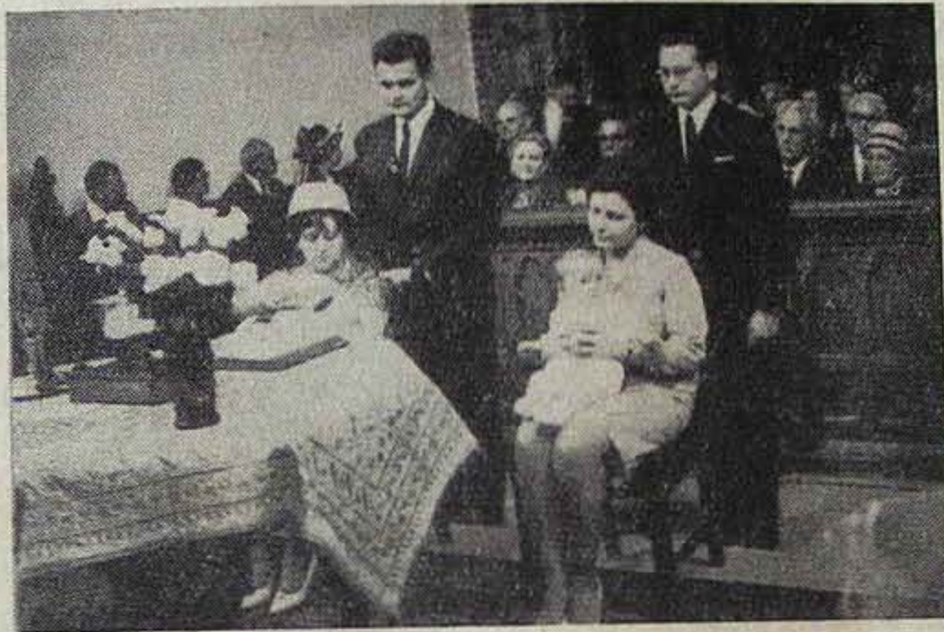
Kettős keresztelővel nyitotta meg kapuit a Zsinat előtt az újonnan renovált Nagy Ignác utcai templomunk

A zsinat első munkaszakasza ezzel véget ért, amikor a jubiláris megemlékezésekre került a sor. Elsőként Prantner József államtitkár, az Állami Egyházügyi Hivatal elnöke köszöntötte 400 éves történelmi múltját ünneplő unitárius anyaszentegyházunkat. Sajnáljuk, hogy nem tudjuk egész terjedelmében visszaadni gondolatokban gazdag, államférfiúi böl-