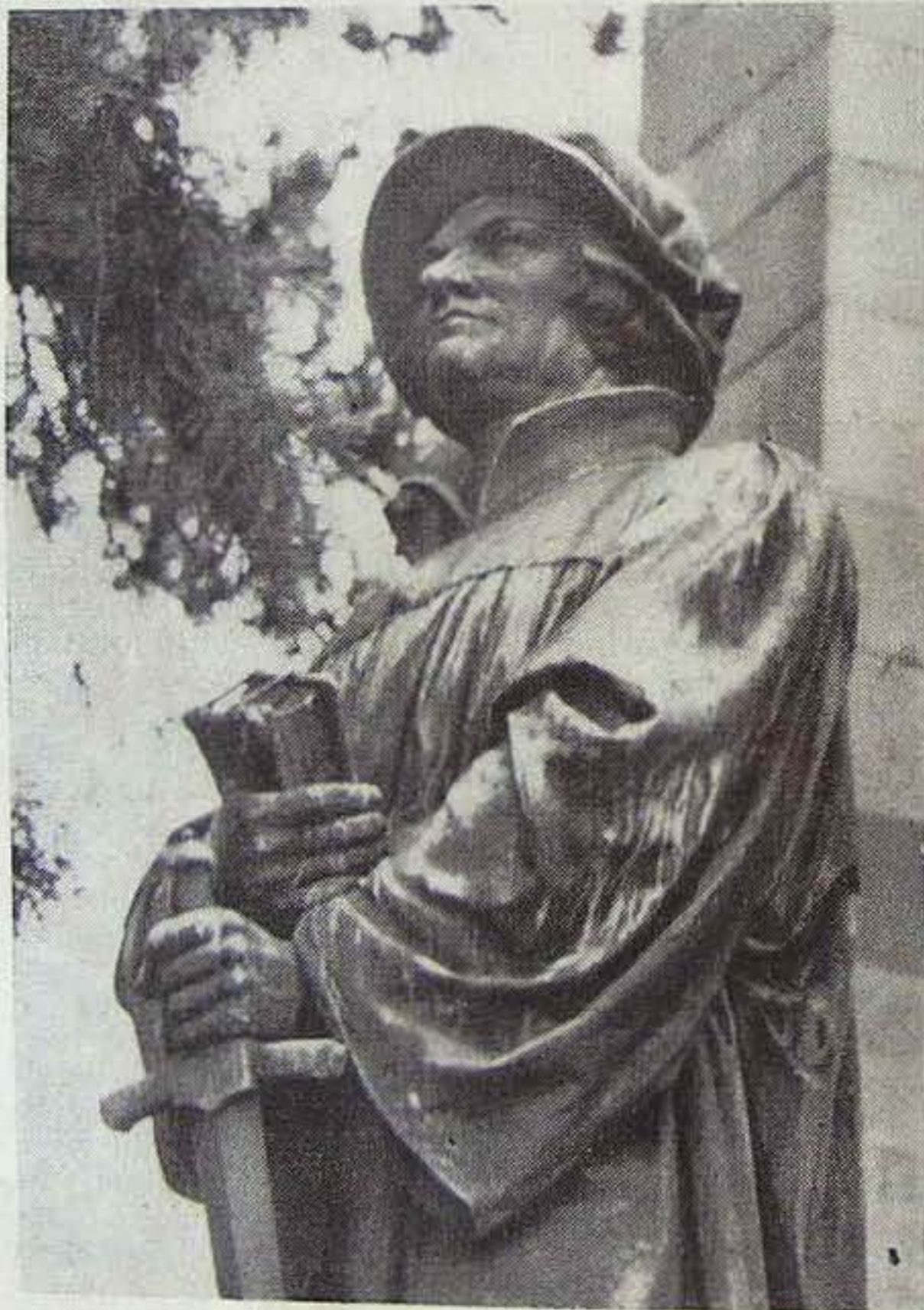
A Zwingli-szobor Zürichben

A magyar köztudatban általában úgy él a svájci reformáció, mint amely körülbelül azonos a reformációnak azzal az egyházi és hitelvi formájával és tartalmával, amelyet a 400 éves történelmi magyar református