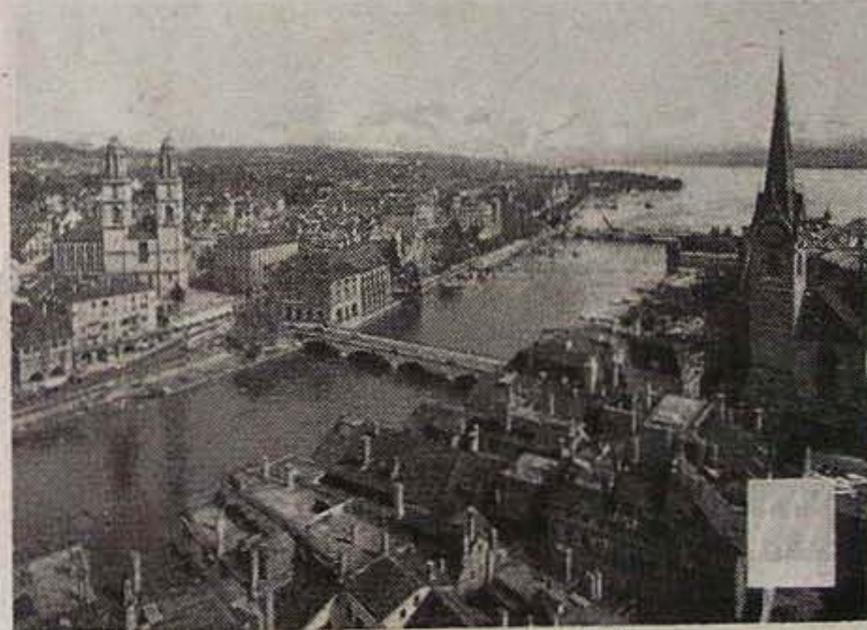
Zürich, a kéttornyú Grossmünsterrel