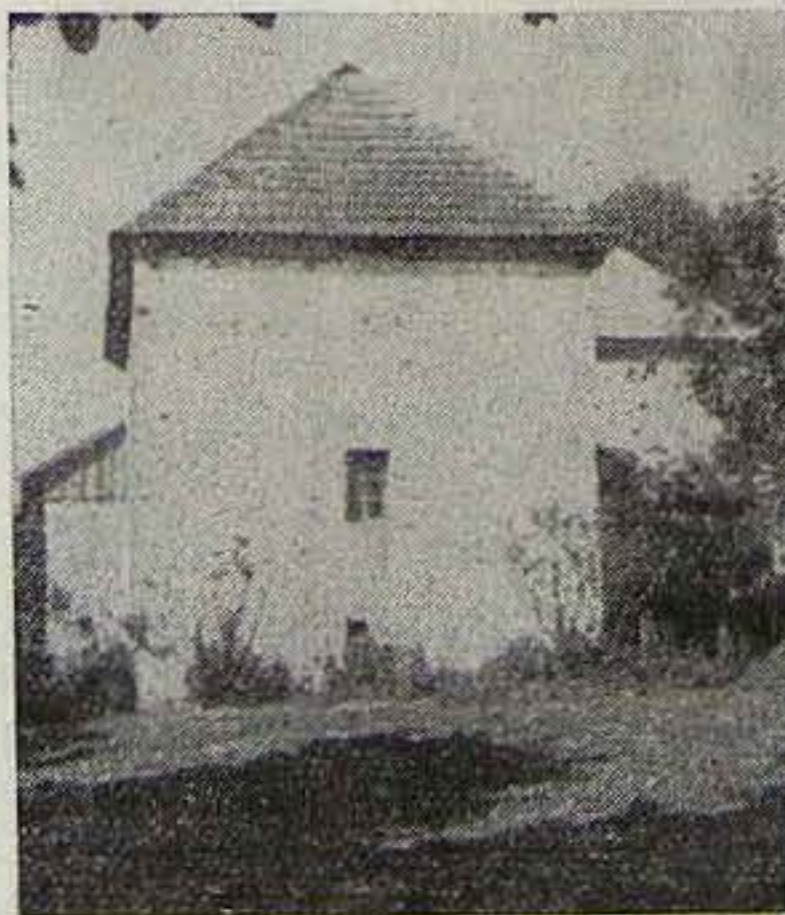
Ariánus templom Rakowban

gyar nyelven tartott közös egyháztörténeti múltunkról előadást.