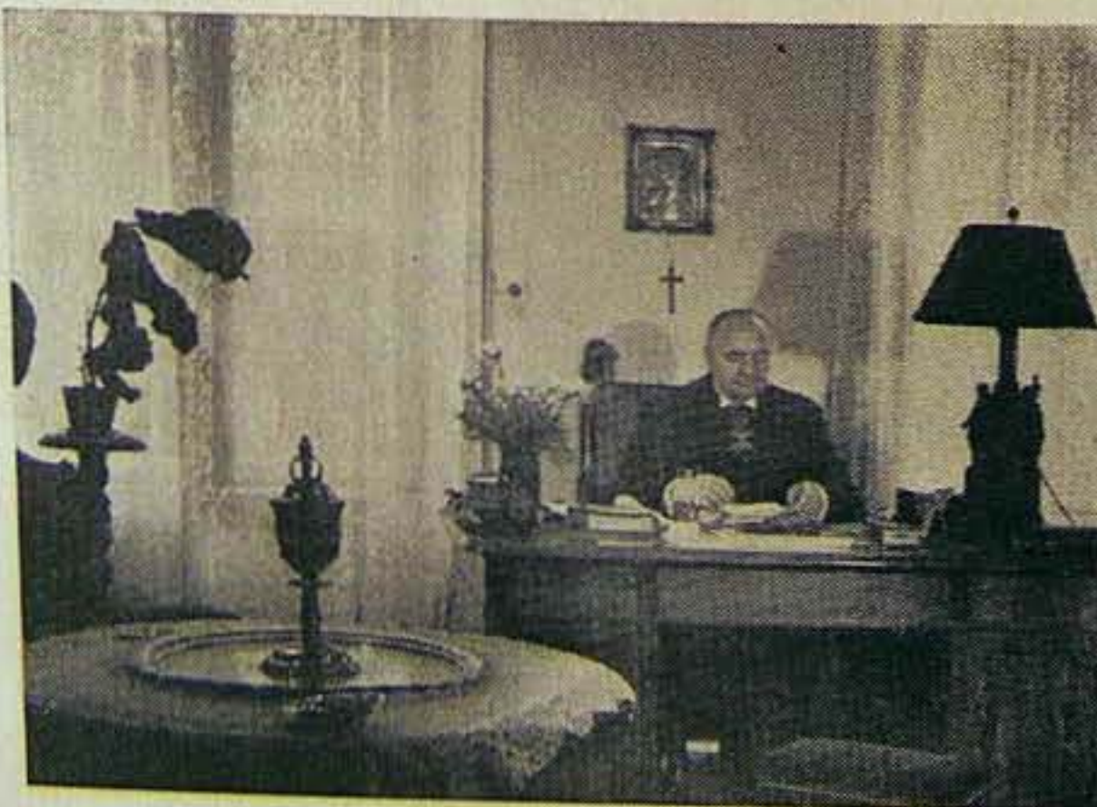
2 UNITARIUS ELET