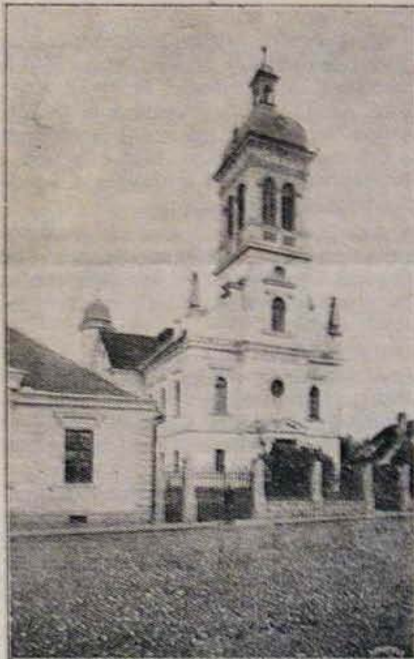
A székelyudvarhelyi unitárius templom