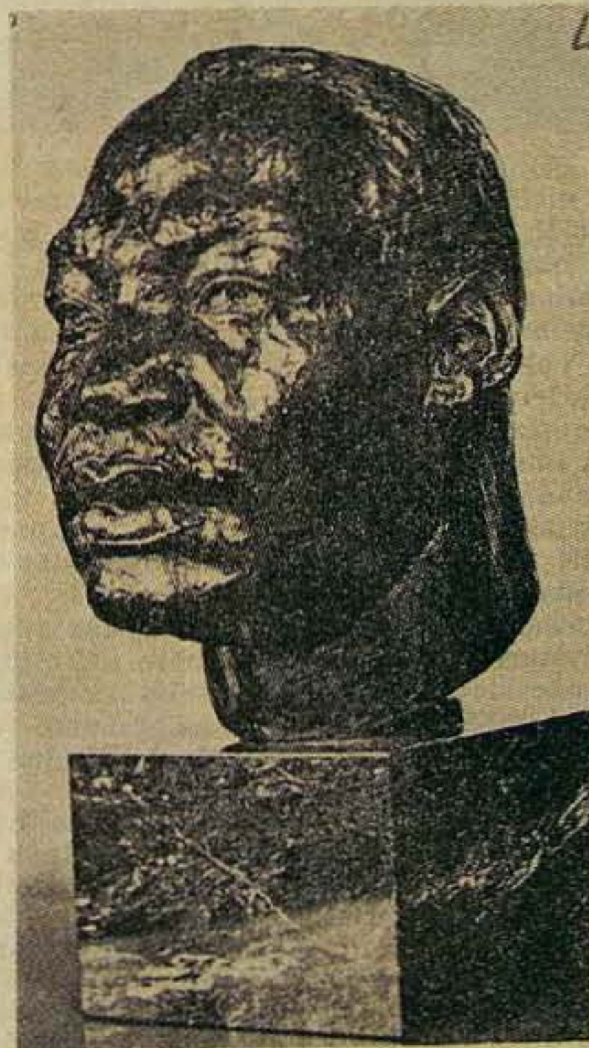
Dr. Martin Luther King négy évvel ezelőtt, 1968. április 4-én szenvedett mártírhalált. Élete és munkássága a haladó amerikai egyházaknak is példát mutatott. Halálát megelőző évben beszédet mondott az amerikai unitárius univerzalista egyház évi közgyűlésén. Az egyik legnagyobb amerikai unitárius-univerzalista gyülekezet, a New York-i Community Church két hívének adományából felállította a templomban dr. King képünkön is látható szobrát.