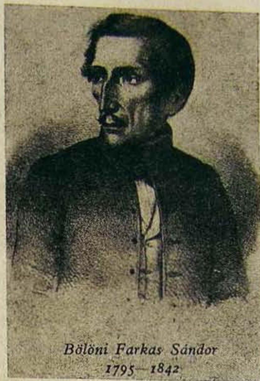
Bölöni Farkas Sándor 1795–1842

1830 novemberében indultak el Kolozsvárról. Először beutazták Németországot, Hollandiát, Belgiumot, Franciaországot és Angliát. 1831. július 27-én Londonban szálltak hajóra, majd megérkezve New Yorkba bejárta az Egyesült Államokat és Kanada déli részét. 1832. január havában érkezett haza.