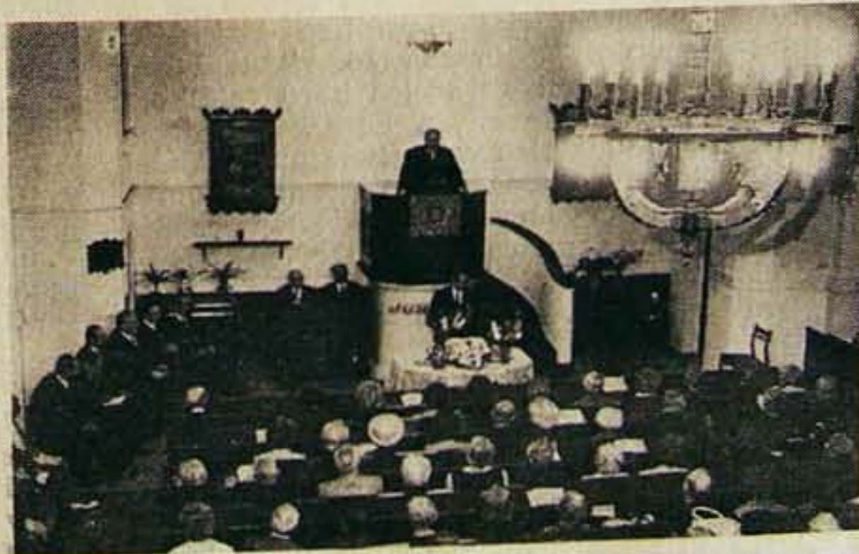
A felújított Hőgyes Endre utcai templomunk felszentelési ünnepsége, 1973. szept. 2-án.