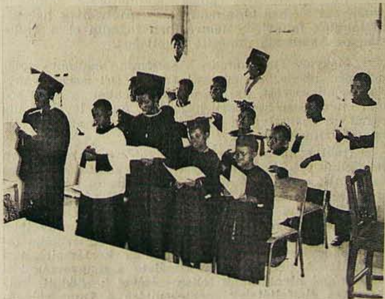
A lagosi unitárius gyülekezet énekkara

Bartók Béla főgondnokunkat fogadta a lagosi Magyar Nagykövetség ügyvivője — a szabadságán levő nagy-