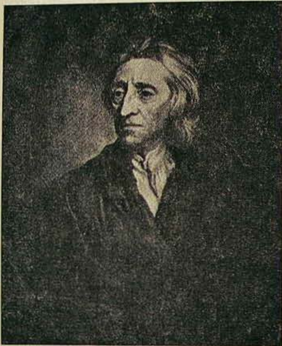
John Locke portréja, — a kép eredetije a leningrádi Ermitázs múzeumban van.

Ebben az esztendőben van kétszáz éve annak, hogy 1774. ápr. 17-én Theophilus Lindsey megnyitotta az első unitárius templomot London ismert főutcájáról, a Strandról a Temze folyó felé nyíló Essex utcában. Ezen a helyen áll ma a nagy-britanniai unitáriusok központi székháza. Lindsey szabadelvű nézetei miatt vált ki az anglikán államegyházból. Első nyilvános unitárius istentiszteletén mintegy kétszáz hallgató volt jelen, köztük sok az anglikán államegyháztól elszakadt lelkész, az angol főnemesi rend egyik tagja és a közismert