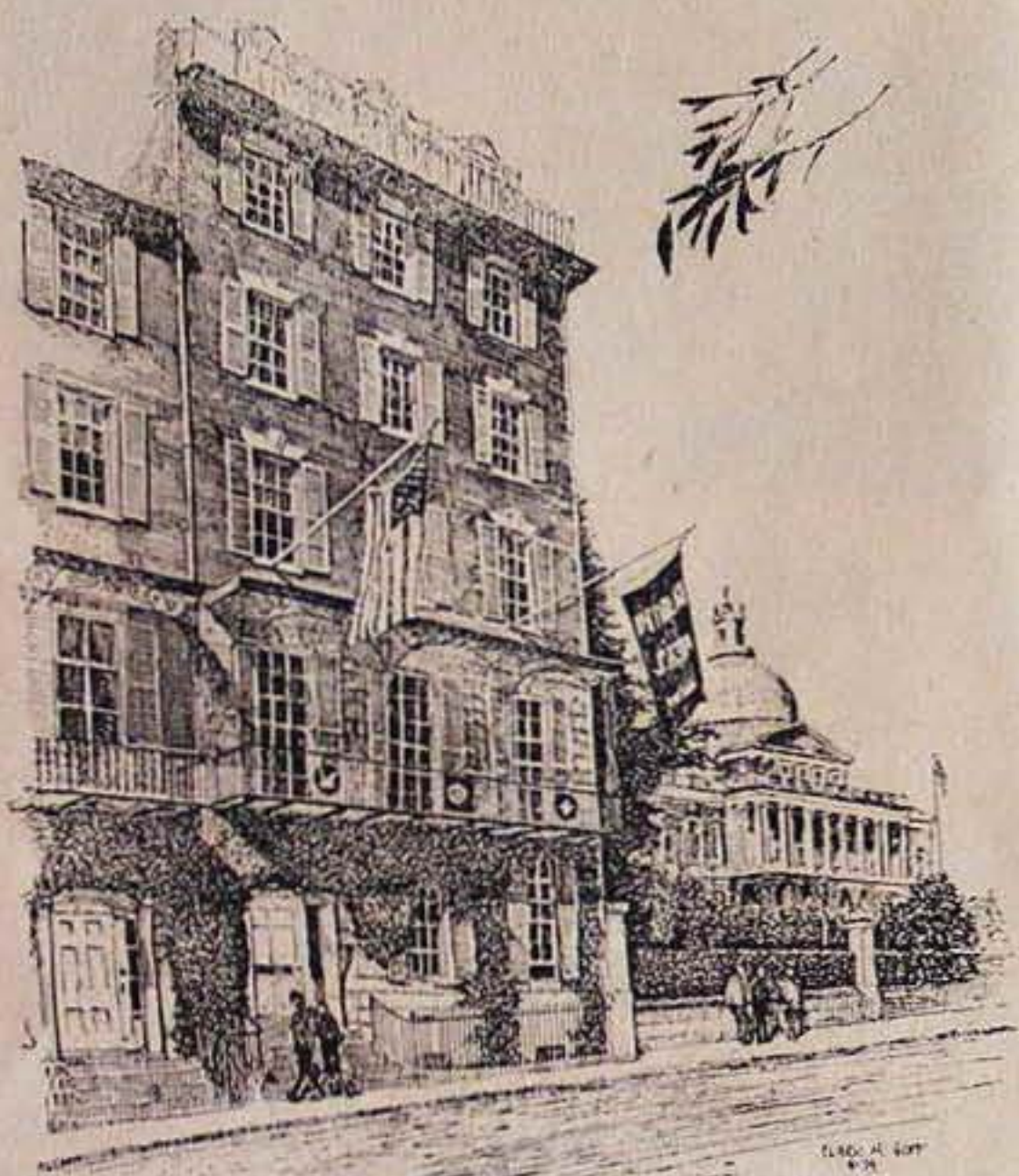
26 BRADON STREET

A XVIII. század második felében, az angol szigetországban és a gyarmati igát éppen levetkőzött új világban, az Egyesült Államokban különböző belső erjedés és külső ráhatások következtében unitárius gyülekezetek keletkeztek. Az angliai unitarizmus elindítóit Lindsey és a lelkész és tudós Priestley voltak.