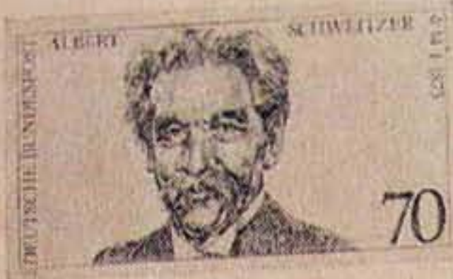
Albert Schweitzer 1875—1965

A Magyar Posta idei első bélyegüjdon-sága Albert Schweitzer, a kiváló humanista, teológus, orvos, zenetudós, orgonaművész és Nobel-Bekedíjas születésének 100. évfordulója tiszteletére kiadott het címlemből álló művészi sorozat volt. A centenarium alkalmából több ország postaja jelentetett meg bélyeget. Ezek közül olvasóinknak bemutatjuk a Magyar Posta 4 Ft-os értékűt, melyen az 1952. évi Nobel-Bekedíj szerepel, amit 1953-ban adtak át Albert Schweitzernek, valamint a Német Szövetségi Köztársaság postaja által kiadott 70 pfennig névértékű, Albert Schweitzer arc képét ábrázoló bélyeget.