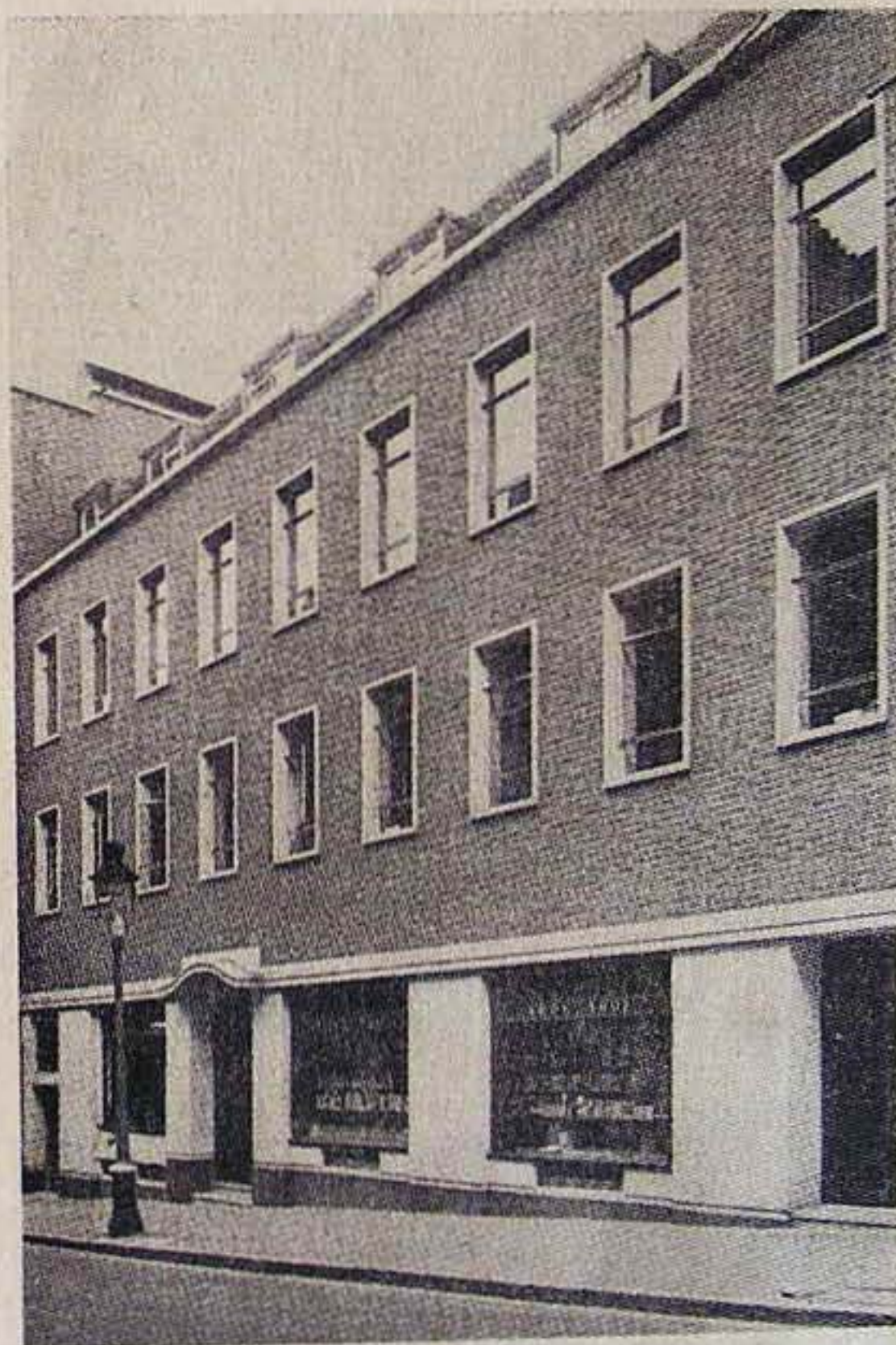
ESSEX HALL, 1958

1825. május 25-én, egyszázötven esztendővel ezelőtt, az angliai Londonban és az amerikai Bostonban egymástól függetlenül egyugyanazon a napon ültek össze az angliai és amerikai unitárius gyülekezetek képviselői, hogy közös központi egyházi szervezetet hozzanak létre. Az angol unitáriusok Inquirer — érdeklődő, tudakozódó — néven 1842-ben indítják meg hetilapjukat, mely ma is rendszeresen megjelenve egyike a szigetország legrégebben alapított egyházi lapjának. Az amerikai unitáriusok és a velük egy időben megszerveződött univerzalisták a nagy ország különböző részein számos folyóiratot indítottak. Szellemi vezér-