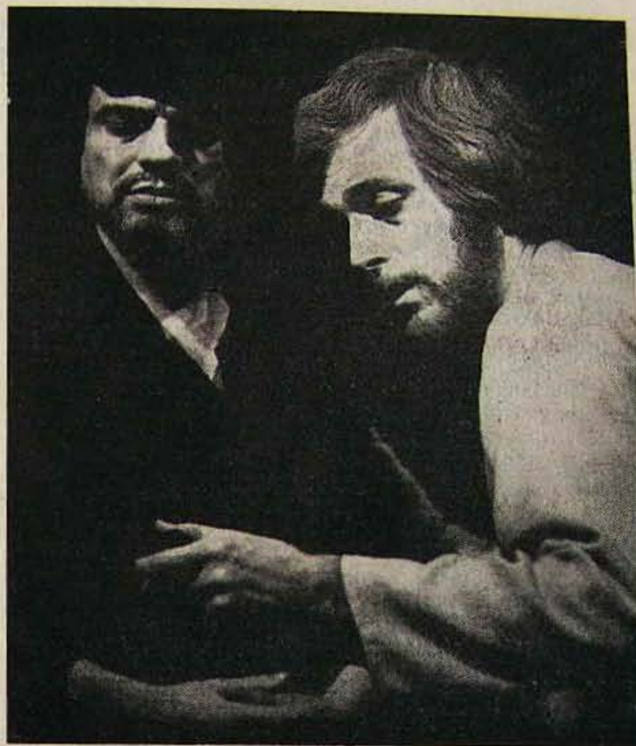
Kálvin és Szervét