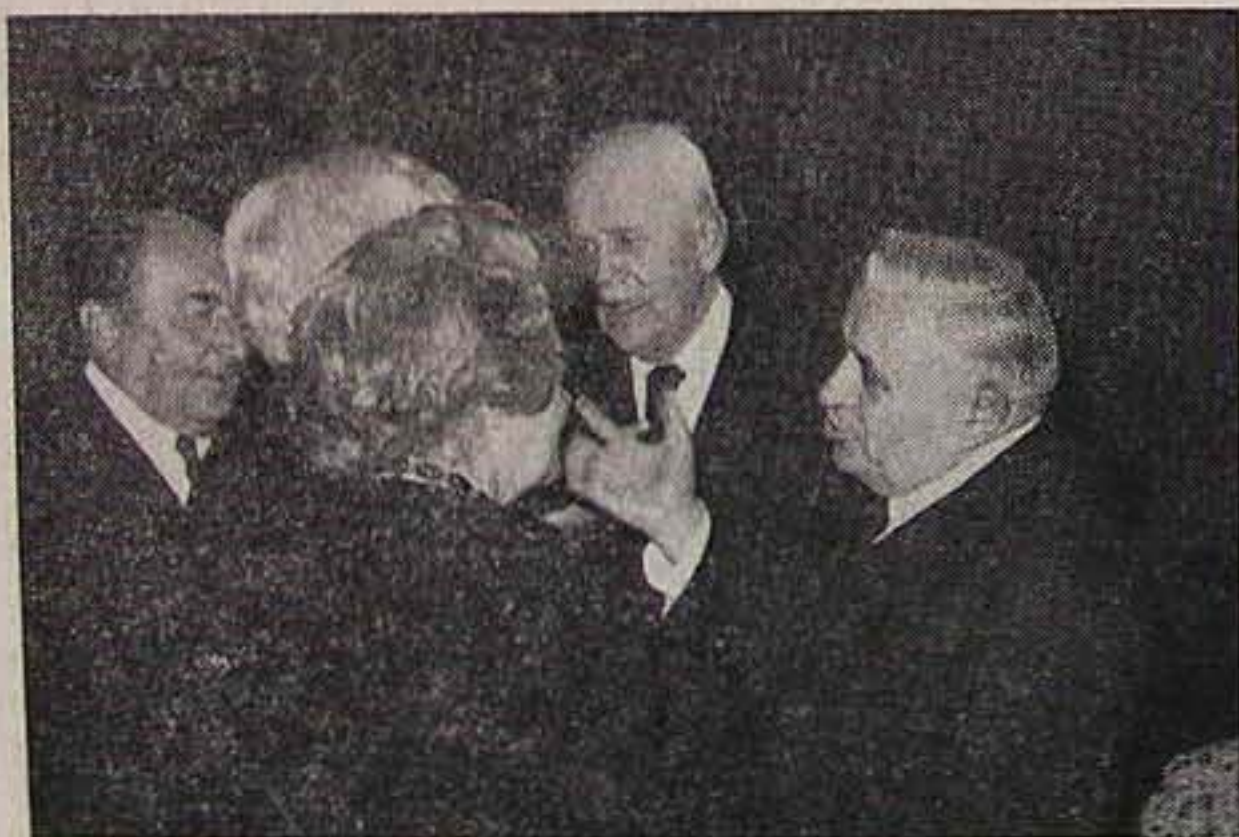
Kovács Lajos dr. és Ferencz József dr. püspökök beszélgetnek a Zsinat asszony küldötteivel

Ebben az áhítatos, ünnepi órában 120 erdélyi gyülekezet nevében az itt jelenlevők hitbeli meggyőződésének és nemes vallásos öntudatának a szellemében tanúbizonyoságot szeretnék tenni arról, hogy az unitárius egyház több mint négyszáz év hősi küzdelmében magas rendű hivatását lélek szerint teljesítette. A Jézus szellemét magán hordozó és a Dávid Ferenc lángoló lelkületével megszentelt gyülekezeteink minden időben a tiszta, sallagnélküli, érthető és áhítatra készítő evangéliumot hirdették és gyakorolták. Egyházunk egész történelme folyamán az ésszerű hitnek, a lelkiismeret szabadságának, a szüntelen fejlődésnek, az állandóan tökéletesülő magas rendű életnek ápolója, ösztönzője, támogatója volt és az kíván lenni a jövőben is.