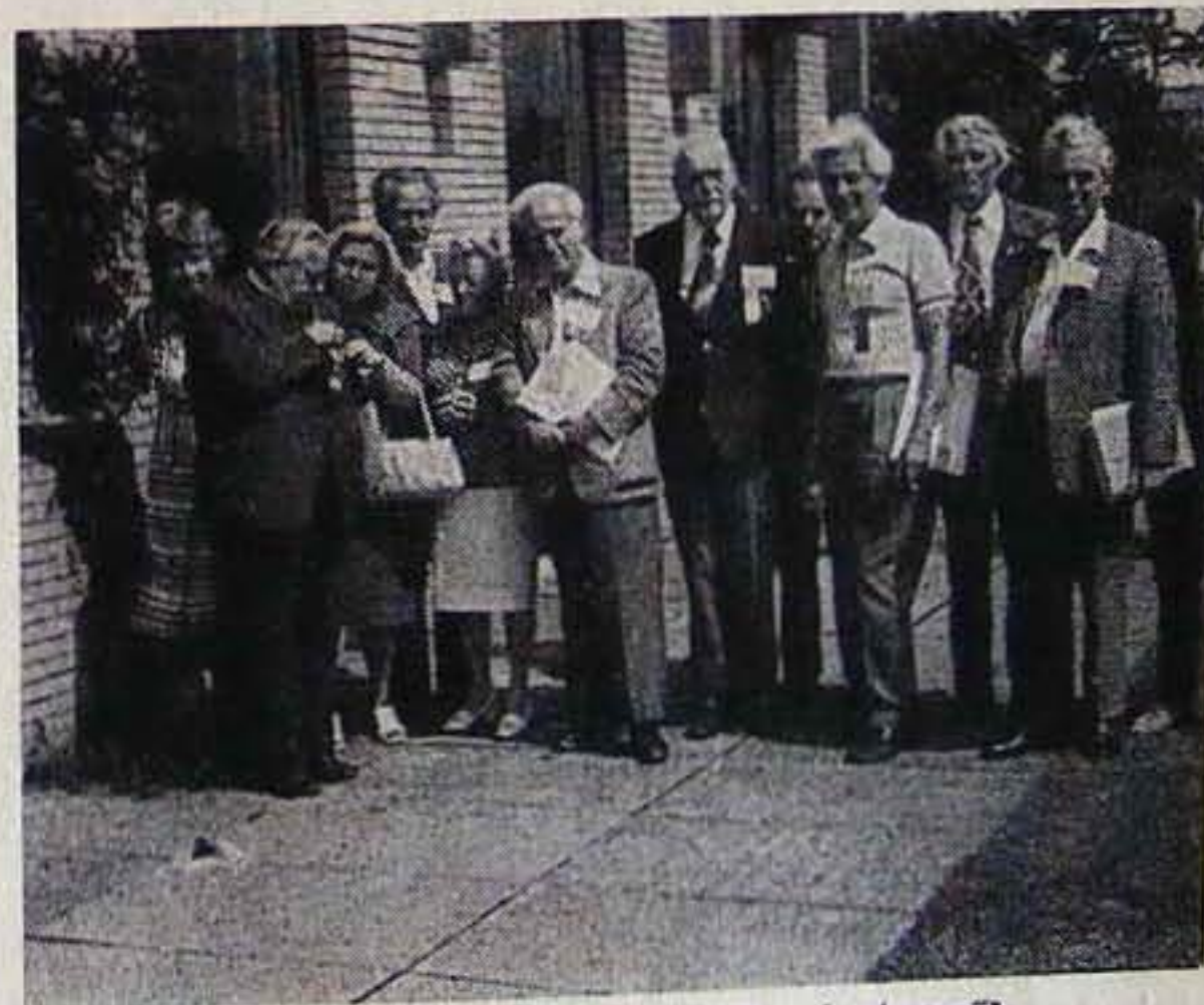
A kolozsvári és budapesti résztvevők

Ezeken a reggeli áhitatokon a közel 450 résztvevő